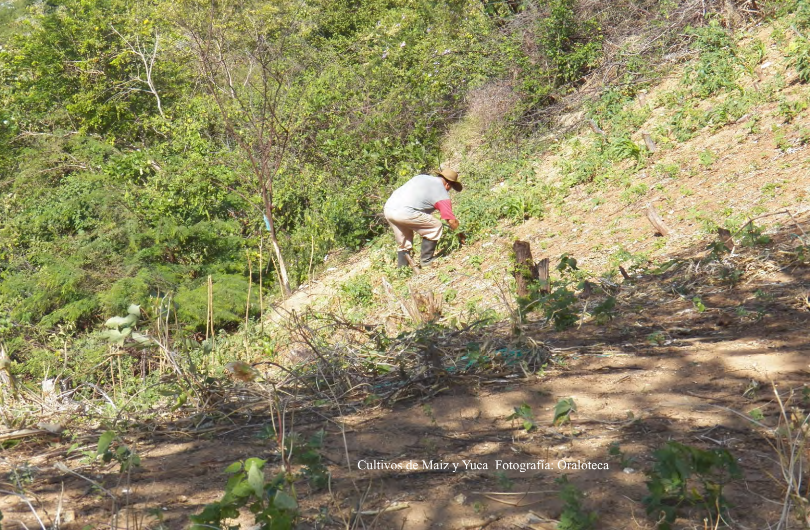
Cultivos de Maiz y Yuca

los habitantes del barrio, el cual se tiende a comercializar el agua por parte de tres familias que se han apoderado y se han beneficiado por su ubicación, de todos los puntos estratégico desde donde extraen el agua, ante estos hechos dentro de la dinámica del sector el agua ha sido una delimitante en términos de territorio, debido a que la toma de este líquido se efectúa en la zona baja de este barrio que concentra la adquisición del agua potable, por esta razón dentro de la misma dinámica territorial del barrio podemos encontrar de que se encuentra una división imaginada entre los mismos habitantes que se disputan la distribución del líquido.