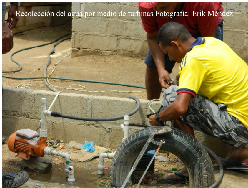
Recolección del agua por medio de turbinas

Si algo ha caracterizado la construcción u organización de la ciudad de Santa Marta desde sus inicios es la poca planificación de su territorio, por lo menos desde lo que se refiere a la visión gubernamental y lo que esta implica; refiriéndose