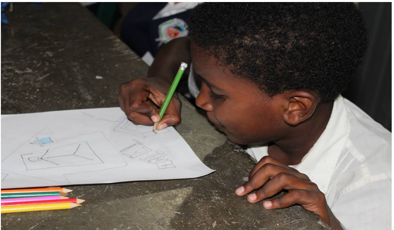
Taller de cartografía social sobre Zika con niños de la Institución Educativa Luis Rodríguez Valera / Yecelys Padilla, 2018

Son consideradas enfermedades culturales el “mal de ojo”, “el pujo”, “aires”, “susto”, entre otras enfermedades que difícilmente pueden encajar en la clasificación de la medicina occidental, esto, se puede