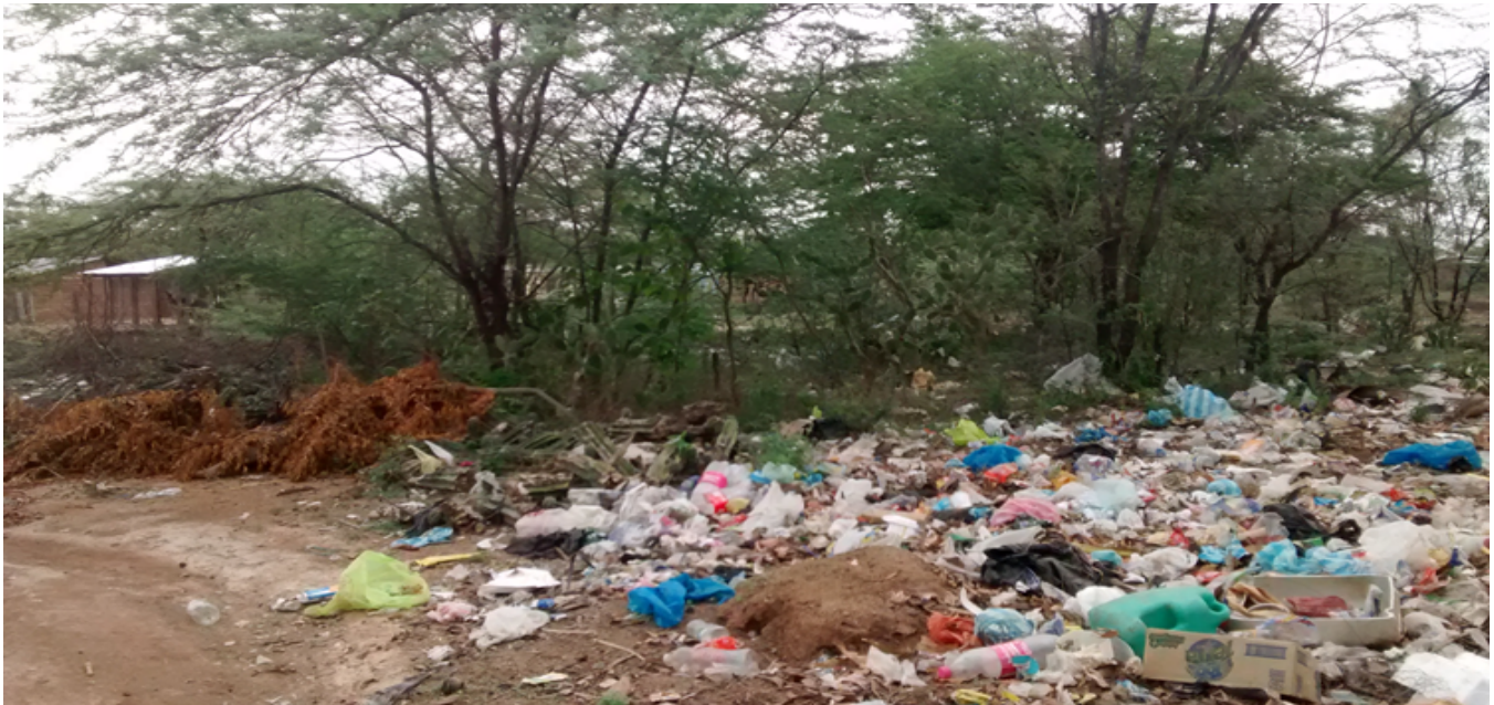
Residuos sólidos depositados en zona habitadas del corregimiento

exponen que las poblaciones que habitan en lugares que se encuentran por debajo de los 2.200 msnm son susceptibles a padecer la enfermedad, ya que las condiciones de estos territorios permiten la proliferación del vector. Aunque en muchos casos las condiciones están asociadas a aspectos culturales, condiciones de las viviendas, dinámicas sociodemográficas, también depende de la calidad de los servicios sanitarios ya que, el mal servicio de estos constituye condiciones ideales para la proliferación del virus (Zambr-