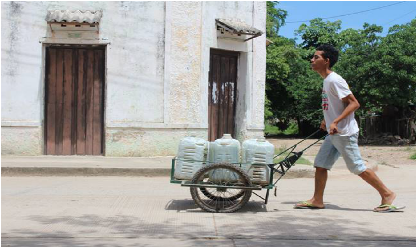
Transporte y almacenamiento de agua en Los Venados

entender mediante la forma en que cada cultura cataloga la enfermedad a través de los conocimientos e interpretaciones que la misma elabora. Las enfermedades modernas para esta población son las que traen muerte y afectaciones fuertes en la salud, como lo es el cáncer, los problemas cardíacos, tumores, entre otras que son atribuidas en gran parte a los daños causados por el hombre como lo es la contaminación. Dentro de estas enfermedades encontramos el Zika, que ha afectado fuertemente a la población causando molestias en la salud y dentro de las mismas desencadenando otras enfermedades que aparentemente estaban sin ser identificadas como lo es la artritis.