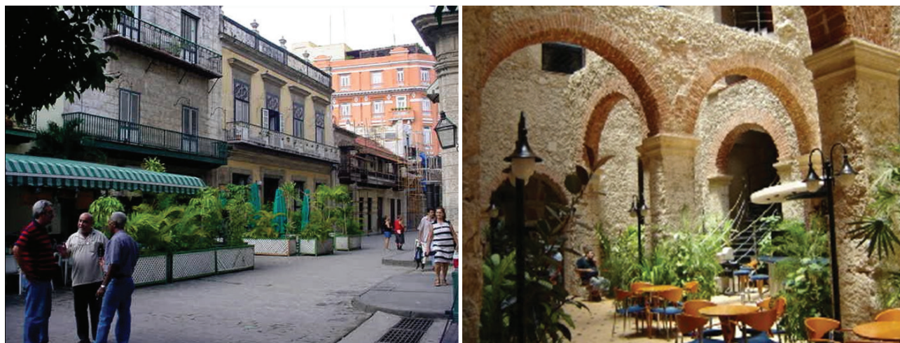
Figura 3. Actividades gastronómicas en la calle Obispo junto a la plaza de Armas y cafetería en el patio del hotel Telégrafo en el entorno del parque Central.

Para cumplimentar el aspecto relacionado con la obtención y manejo de recursos financieros, se creó la compañía Habaguanex S.A. de la OHCH, que tiene a su cargo toda la red gastronómica, comercial y hotelera del Centro Histórico, entre cuyos objetivos se encuentra el de contribuir con sus utilidades al autofinanciamiento de la recuperación de la zona histórica; así como permite la creación de un número considerable de puestos de trabajo, en actividades cuya inversión inicial es recuperable rápidamente. En la actualidad esta compañía de la OHCH opera 18 hoteles y hostales; 54 cafeterías, restaurantes, merenderos, heladerías, dulcerías; 59 tiendas comerciales de diferentes tipos; 2 cajas de cambio, la agencia de viajes San Cristóbal, la Inmobiliaria de Viviendas Fénix S.A., la Inmobiliaria Áurea S.A. para rentar locales de oficina (Figura 3).