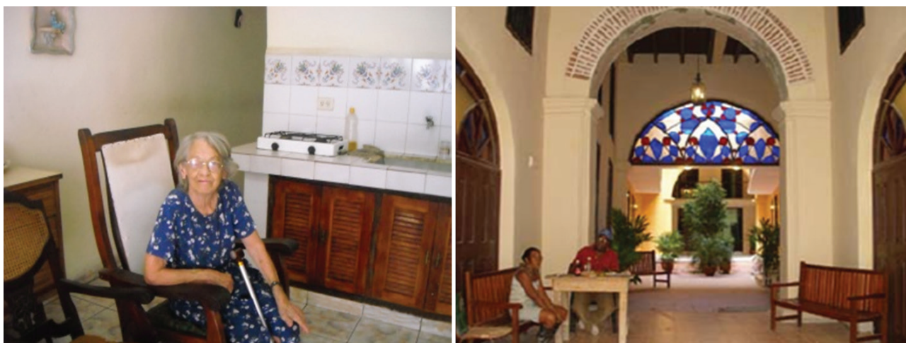
Figura 5. Vista interior de viviendas protegidas en La Habana Vieja.

El programa de construcciones protegidas ha continuado rescatando edificios de viviendas para núcleos pertenecientes al grupo de adultos mayores, cuya presencia en la composición de los habitantes del Centro Histórico es significativa. Los proyectos de estos apartamentos contemplan soluciones libres de barreras arquitectónicas adecuadas para estas personas, consultorio médico y, salas de rehabilitación y espacios lúdicos (Figura 5).