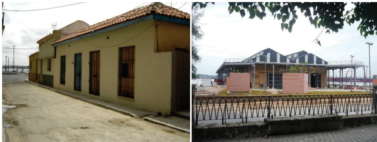
Figura 7. Intervenciones de rehabilitación en viviendas en el barrio de San Isidro y en un almacén del puerto.