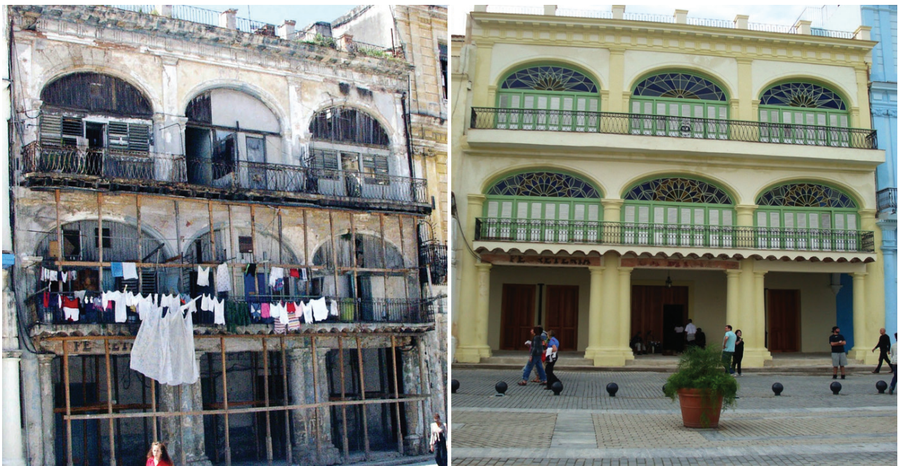
Figura 4. Edificio en San Ignacio 360 rehabilitado para vivienda social con servicios comerciales en planta baja y 15 apartamentos en planta alta. Estado antes y después de la restauración.

La acción renovadora en las áreas históricas de nuestro continente ha tenido ante todo un carácter demoledor, bajo el cual ha sucumbido la historia y la identidad de ciudades enteras. Las experiencias realizadas en La Habana Vieja nos arrojan como resultado, que al menos entre el 40–50% de los núcleos que ocupaban los edificios que van a ser intervenidos, no pueden retornar al edificio una vez rehabilitado y tienen que ser reubicados en nuevas viviendas; estas familias no son lanzadas a la calle, ni abandonadas a su suerte, se les asigna una nueva vivienda que satisfaga sus necesidades y demandas, lo que requiere la creación y construcción de un fondo habitacional adicional que de respuesta a esta necesidad social. Esto retarda a veces, el proceso de desocupación y del inicio de las obras en los inmuebles patrimoniales del centro histórico (Figura 4).