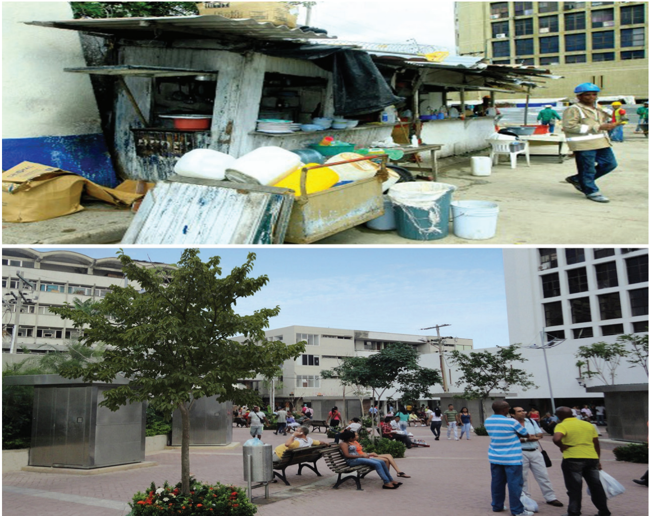
Figura 13. Vista de la plazoleta de las Empresas Públicas hoy Joe Arroyo en el sector de La Matuna. Estado antes y después de la rehabilitación.

Las obras del Paseo de Puerto Duro; la plazoleta de Telecom, hoy Benkos Biojó; la plazoleta de las Empresas Públicas, hoy del Joe Arroyo, la plaza de la Aduana y el parque del Centenario, comenzaron a finales de 2010 y continuaron desarrollándose durante el 2011 y se concluyeron todas con excepción del parque del Centenario en que quedaron paralizadas, en estos momentos se han reiniciado los trabajos para su conclusión (Figura 13).