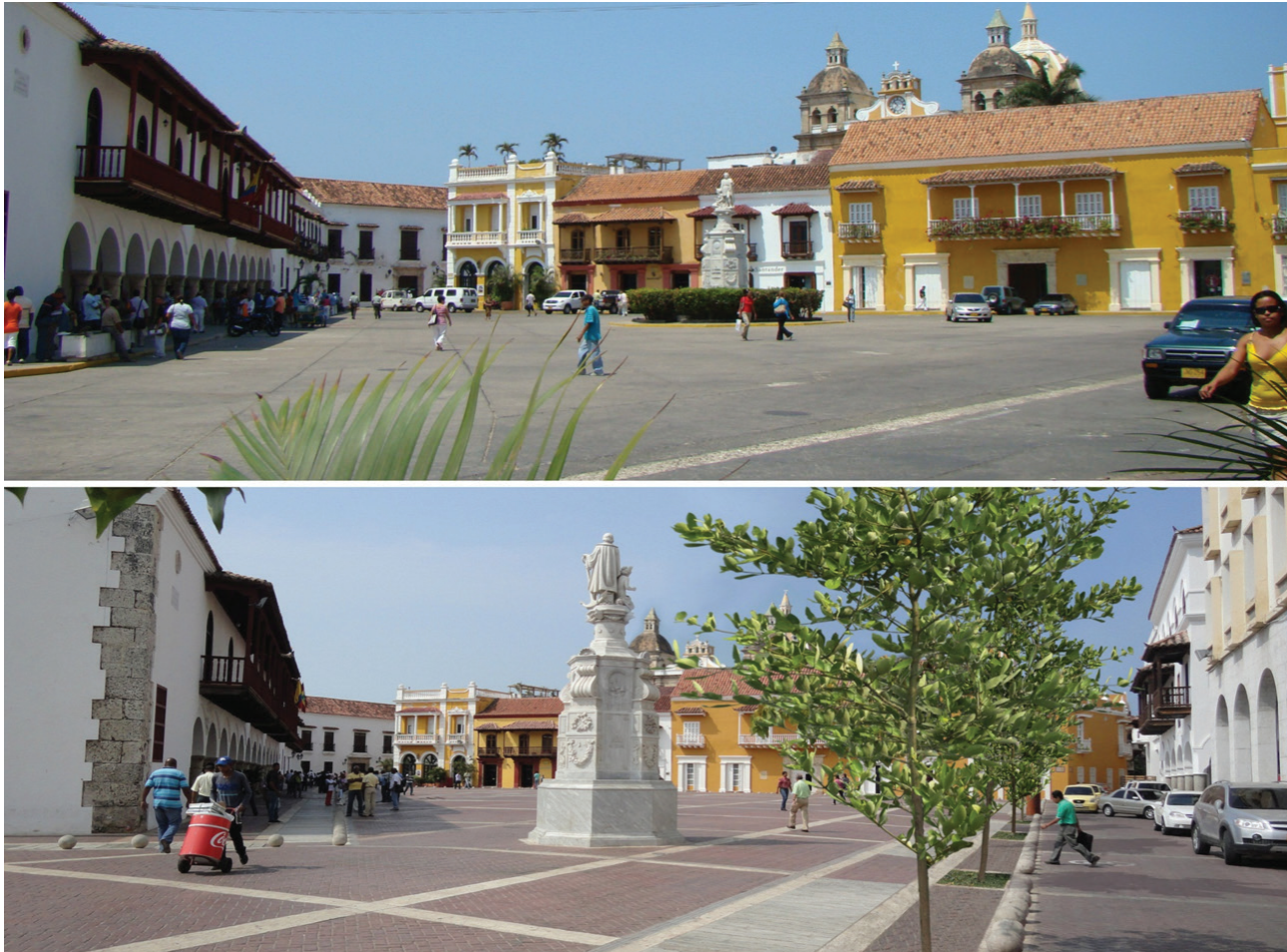
Figura 14. Vista de la plaza de La Aduana en el Centro Histórico. Estado antes y después de la rehabilitación.

Afortunadamente, la actual administración distrital se ha interesado en continuar con la ejecución del Plan de Revitalización del Centro Histórico de Cartagena de Indias, suspendido durante el gobierno anterior (Figura 14).