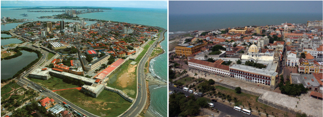
Figura 9. Vistas aéreas del centro histórico de Cartagena de Indias y sus murallas.

Centro, San Diego y Getsemaní y el área de La Matuna, un sector urbanizado en la segunda mitad del pasado siglo en el que aparecen algunos exponentes destacados de arquitectura racionalista y que constituye una expresión de la modernidad urbana y arquitectónica de su momento (Figura 9).