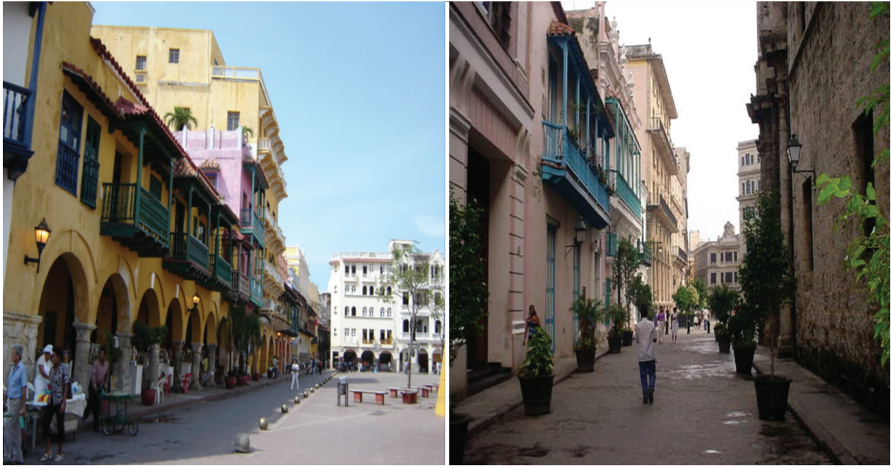
Figura 1. Vistas generales del ambiente arquitectónico y urbano de una calle de los centros históricos de La Habana y Cartagena de Indias.

mar, posee una extensión aproximada de 2. 14 km 2 , con alrededor de 3300 edificaciones de las cuales, una tercera parte pertenecen al período colonial entre los siglos XVI al XIX, con un alto valor arquitectónico y alberga una población cercana a los 70 000 habitantes (Figura 2).