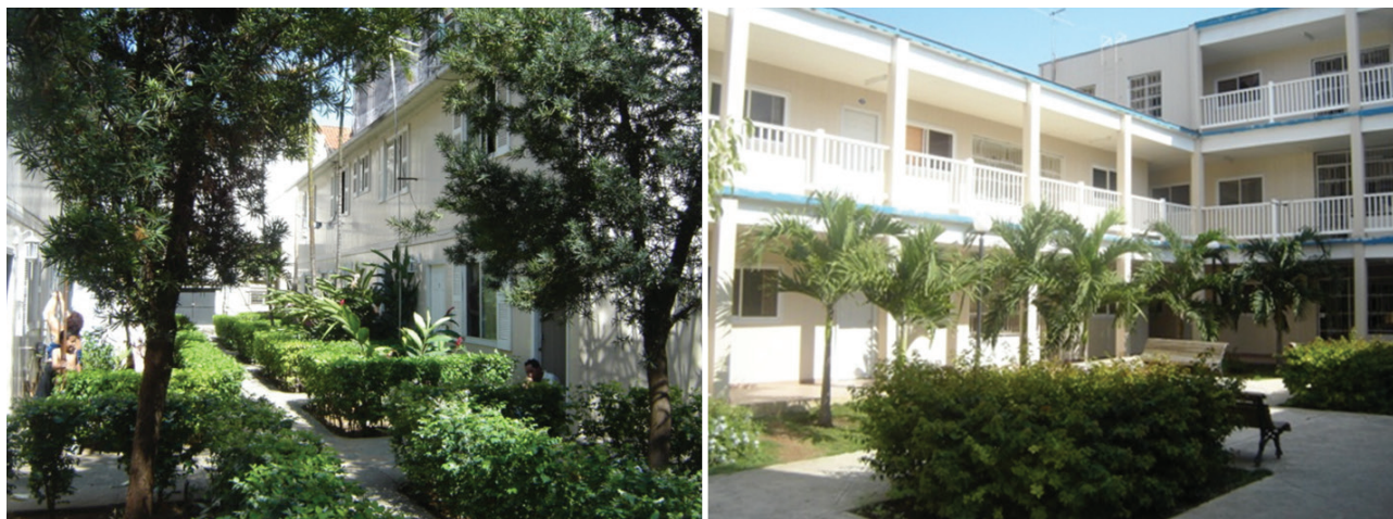
Figura 6. Vistas generales de dos comunidades de tránsito, en la Plaza Vieja y el barrio de San Isidro.

Incorpora como parte del taller a los 38 organismos enclavados en el territorio y a los moradores del propio sitio que constituían una fuerza de trabajo desocupada. El taller entrega también materiales, proyectos y asesoramiento técnico a los habitantes que realizan trabajos con esfuerzo propio, así como alguna mano de obra especializada y cuenta con una oficina técnica que incluye arquitectos, ingenieros, historiadores, sociólogos, psicólogos, etc.