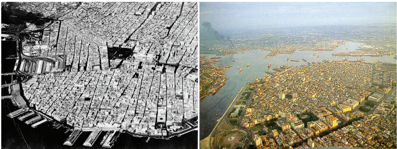
Figura 2. Vistas aéreas de La Habana Vieja en la que puede apreciarse la clara definición impuesta por el trazado de la muralla demolida a partir de 1863.