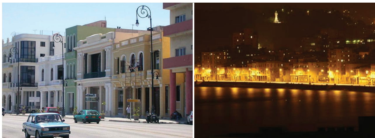
Figura 8. Acciones de rehabilitación de viviendas y del alumbrado público en el Malecón tradicional.