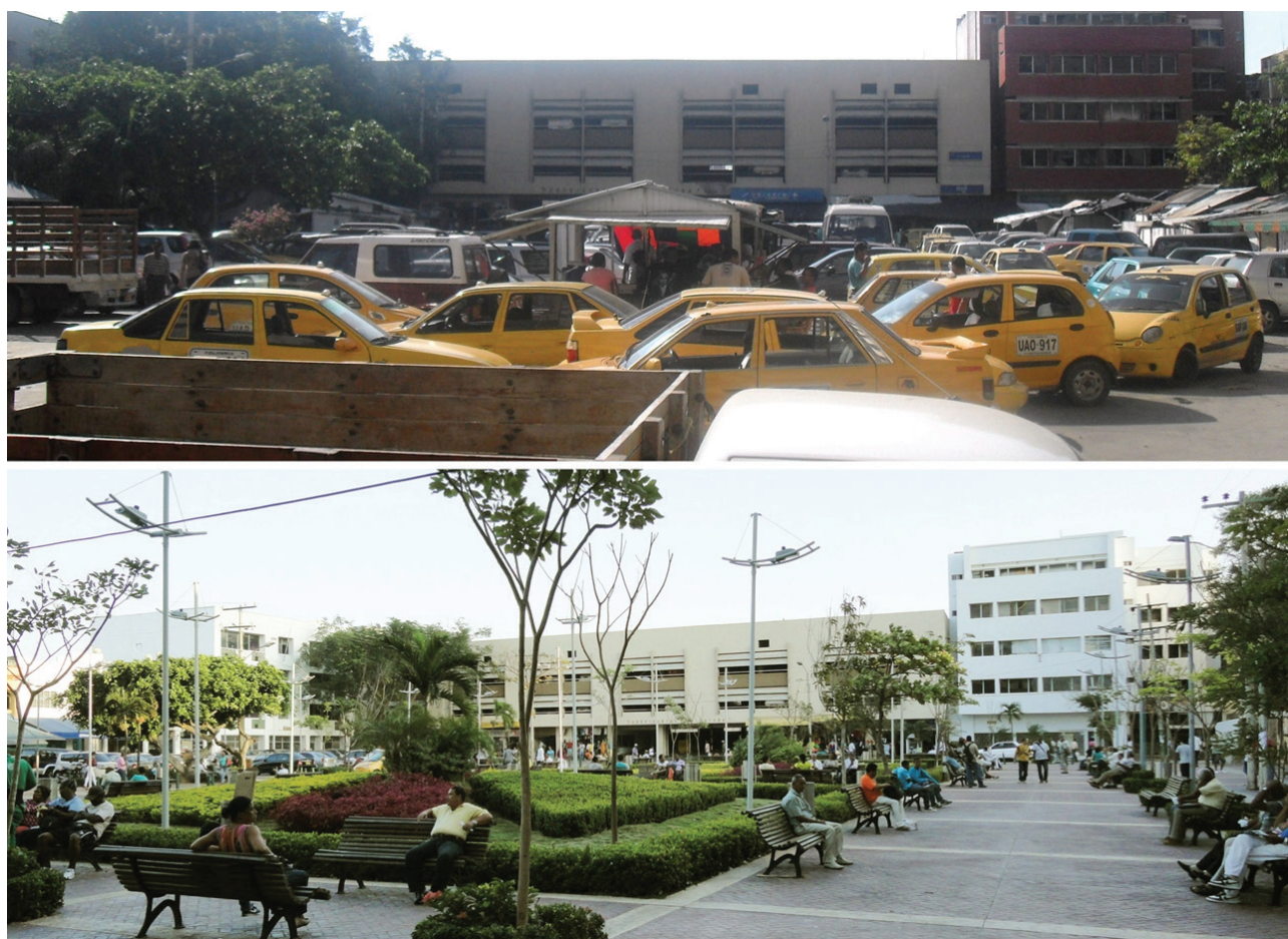
Figura 12. Vista de la plazoleta de Telecom hoy Benkos Biojó en el sector de La Matuna. Estado antes y después de la rehabilitación.

De manera particular para el sector de La Matuna, que en los estudios anteriores no se tomaba en cuenta como parte del Centro Histórico, se propusieron intervenciones que a la vez que revitalizaron las actividades en sus plazas interiores, consolidaron los ejes tradicionales que siempre las habían vinculado, dotándolos de adecuadas condiciones urbanísticas, físicas y ambientales, para convertir este sector en un fuerte nodo de articulación de los recorridos peatonales provenientes de los barrios del Centro y San Diego con el de Getsemaní (Figura 12).