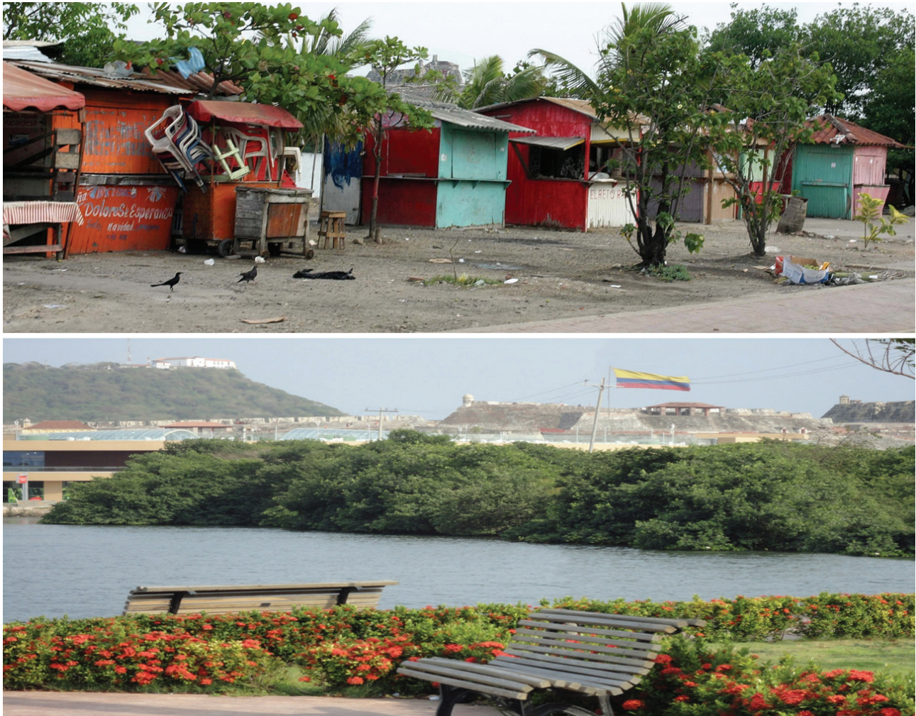
Figura 11. Paseo peatonal de Puerto Duro junto a la laguna de Chambacú. Estado antes y después de la rehabilitación.

El Plan consta de dos componentes: el urbano-arquitectónico y el socio cultural, que tiene como objetivo fortalecer y consolidar la programación cultural del Centro Histórico, así como vincular a los habitantes de la periferia a disfrutar de sus plazas, y monumentos. Igualmente se orienta a capacitar a artesanos, artistas de las plazas y calles, vendedores estacionarios, taxistas, cocheros, estudiantes, comunicadores sociales en cultura ciudadana (Figura 11).