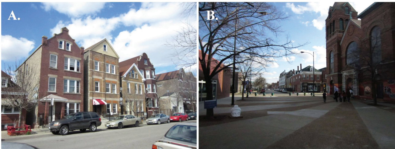
Figura 5. A. Mejoramiento de edificios promovido con recursos de TRP. B. El Zócalo en el Barrio de Pilsen.

rico, desde sus inicios fue multicultural por los diversos grupos étnicos que aquí se asentaron. Ahora ocupado por mexicanoamericanos, se enriquece en colores con la cultura y el espíritu, de estos nuevos habitantes que lo están revitalizando. La proximidad que tiene el barrio con el campo de la universidad de Illinois, la proximidad con el Río de Chicago y algunas fábricas que aun están en operación, lo han convertido en un barrio asediado para muchos, entre ellos los mexicanos. La comunidad mexicana que vive en el barrio tiene retos importantes que enfrentar, uno de ellos es el fenómeno de gentrification , que desplaza a los habitantes de bajos recursos para dar lugar a los de altos recursos, debido a su excelente ubicación en la ciudad. Este fenómeno asecha al barrio desde hace más de diez años y sigue creciendo.