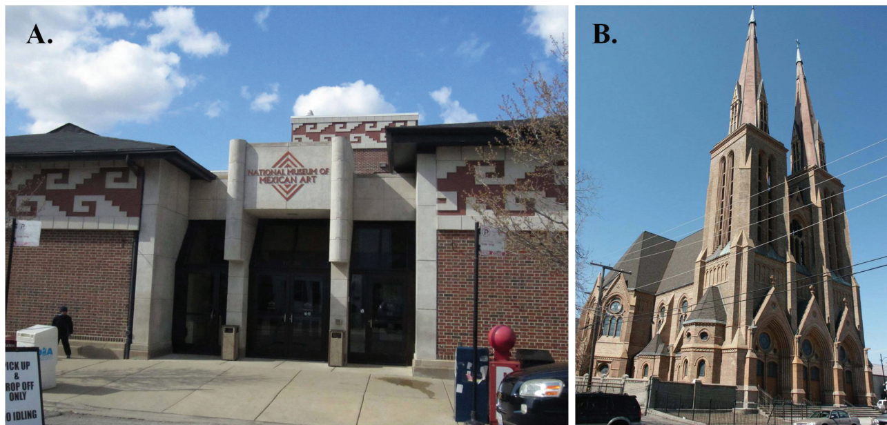
Figura 3.A. Entrada al Museo Nacional de arte Mexicano en Pilsen. B. Iglesia de San Paulo en el Barrio de Pilsen.

La apropiación del espacio del parque, no sólo ha sido física sino también social. Se aprovechó la gran cantidad de mexicanos en ese lugar y con ello generar este importante espacio cultural. (Figuras 3a y b)