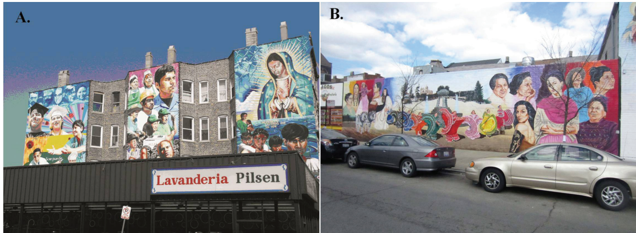
Figura 2. A. Murales en el Barrio de Pilsen. B. Murales en el Barrio de Pilsen.

canos. Muchos de los motivos de estos murales son alusivos a las luchas por los derechos sociales y raciales en esta ciudad. Son mensajes de las luchas y esfuerzos, que han soportado para sobrevivir en este país. (Figuras 2a y b)