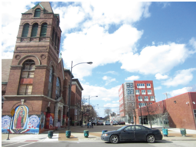
Figura 6. El Zócalo, oficinas del TRP y al fondo casa del estudiante.