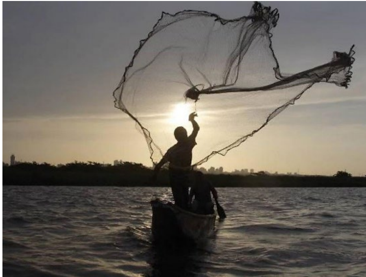
Fig. 1. El pescador