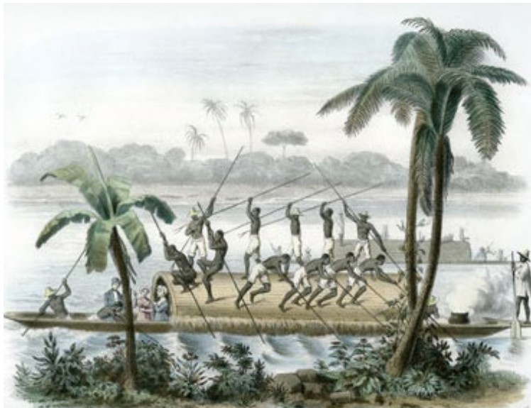
Fig. 2. Champán en el río Magdalena-Colombia. Ramón Torres Méndez

Fuente: 1878 Litografía en color. Registro 3776, 25,5 x 34,7 cm. Donado por el Banco Popular (20.11.1996). Recuperado de (Museo Nacional de Colombia, 2011). http://sinic.gov.co/paginaindependientespiezadelmesagosto2011piezadelmesagosto2011