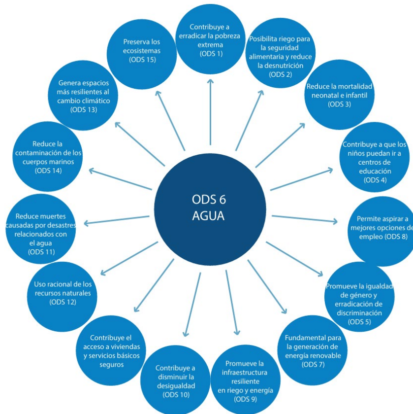
Fig. 5. Incidencia del ODS 6: Agua limpia y saneamiento, con los demás ODS