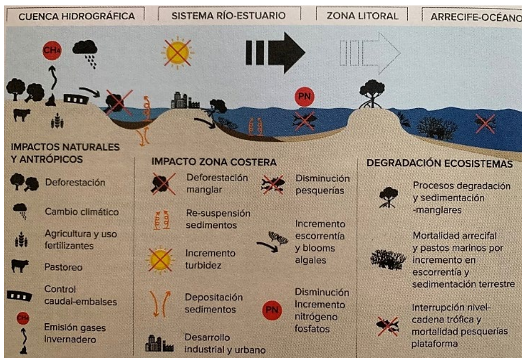
Fig. 4. Sistema continuo cuenca hidrográfica-zona litoral y ecosistemas marinos proximales