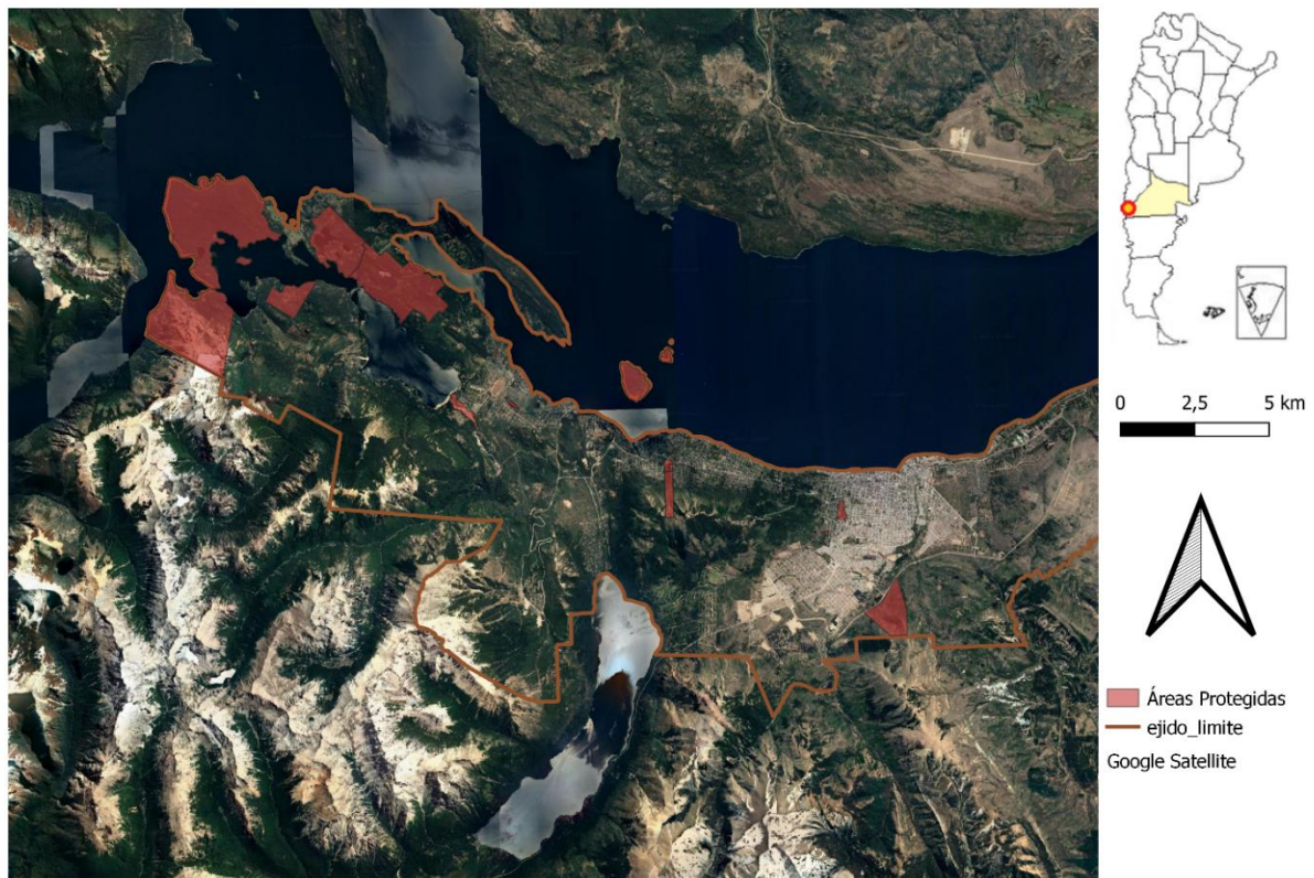
Figura 2. Áreas protegidas en San Carlos de Bariloche

contención (Inclán, 2017). Así se observa que, luego de algunos años de funcionamiento, las comisiones participativas empezaron a mostrar un agotamiento del ciclo contencioso, no tanto por la falta de movilización del activismo ambiental, sino porque la participación se volvió meramente formal y no sustantiva (Pesquero, 2021). Además, los recursos contenciosos adelantados por el movimiento cubrían un amplio espectro, desde la discusión pública en medios periodísticos y la participación en instancias ciudadanas y en controversias ambientales (Llosa & Aguiar, 2017) hasta la judicialización de los conflictos, pero excluyó las movilizaciones tradicionales de otras agrupaciones territoriales o sindicales. En materia de negociación, el movimiento vecinal y ambiental tuvo una activa participación en la discusión legislativa que terminó con la sanción de ordenanzas sobre RNU.