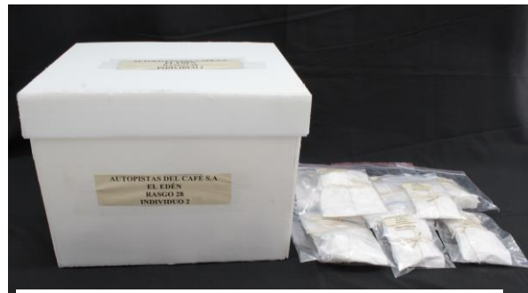
Figura 4. Disposición final del individuo

Una muestra de suelo de cada individuo y contexto es conservada para futuros análisis y guardada en papel aluminio, y otros elementos recuperados durante la limpieza se embalan en una caja plástica con tapa. Todas las bolsas y elementos asociados a un único individuo se deben guardar en cajas individuales elaboradas en cartón plast . Este material consiste en una lámina alveolar de polipropileno que funciona como aislante térmico y acústico, tiene alta rigidez y es impermeable, inmune a hongos y bacterias, liviana y resistente a agentes químicos y a la humedad, por lo que es idónea para conservar material arqueológico. Finalmente, se pone en cada caja un rótulo impreso con la nomenclatura del contexto y del individuo.