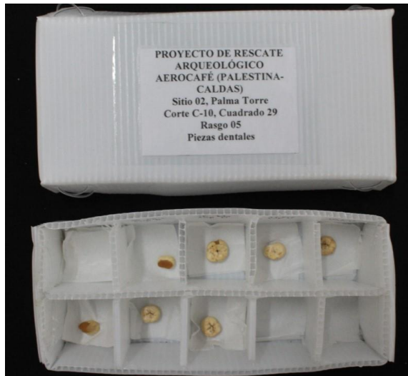
Figura 2. Almacenamiento final de piezas dentales.