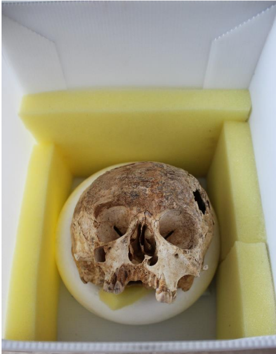
Figura 3. Acondicionamiento de cráneo