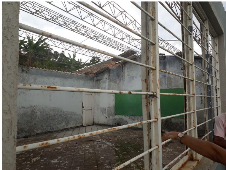
Imagen 3: Ruinas del Comedor Escolar del Colegio Madre Laura. Caldono, Cauca. 2017

La infraestructura complementaria a las actividades educativas, también se vio afectada, una de las afectaciones más sensibles fue la destrucción del restaurante escolar. La siguiente fotografía revela el estado actual: