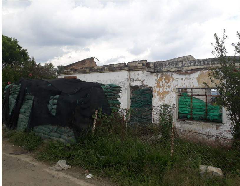
Imagen 2: Ruinas del Colegio Madre Laura. Caldono, Cauca. 2017

La infraestructura complementaria a las actividades educativas, también se vio afectada, una de las afectaciones más sensibles fue la destrucción del restaurante escolar. La siguiente fotografía revela el estado actual: