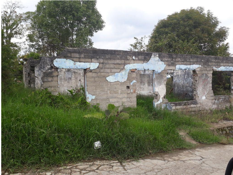
Imagen 1: Ruinas de una vivienda familiar. Caldon, Cauca. 2017