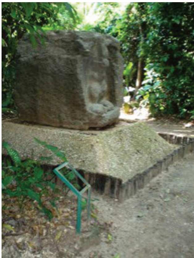
Figura 10. Falta de cédula informativa en exposición de pieza arqueológica.

puede tener un concepto para la puesta en valor de los sitios, no se logra una clara interpretación por parte de los visitantes. Los sitios no muestran un proceso metodológico que defina funciones, áreas, servicios, creando confusión de lo que se está visitando, un museo fuera de muros, un parque arqueológico o un centro de interpretación arqueológica. Los sitios abiertos al público son simples estructuras con cédulas informativas demasiadas técnicas que no contribuyen al conocimiento del sitio por el visitante. Esto no genera una adecuada interpretación y por ende se desconoce y se desvaloriza el patrimonio arqueológico.