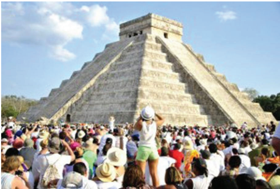
Figura 3. Equinoccio de Chichén Itzá, Yucatán.

que a comprender el concepto de estos sitios como museos abiertos. Estas acciones que incluyen exponer las grandes estructuras monumentales que señorean los espacios urbanos prehispánicos al público, en la mayoría no han sido acompañadas de acciones preventivas para su visita pública, sólo sitios considerados de mayor importancia como Teotihuacán en el Estado de México, el Templo Mayor en la Ciudad de México, Monte Albán en Oaxaca, Palenque en Chiapas, Chichen Itzá y Uxmal en Yucatán entre otros, presentan un mejor proyecto museológico y museográfico incluyendo herramientas tecnológicas para su musealización, mostrando verdadera preocupación por presentarlos a la visita pública como un sentido educativo y turístico. Aquí cabe destacar la importancia que la musealización tiene para la puesta en valor de estos sitios, pues de ella se desprenden las primeras interpretaciones hechas en torno a la cultura prehispánica e indígena de nuestro país, que constituyen un bien patrimonial único e insustituible por su alto contenido testimonial. (Figura 4)