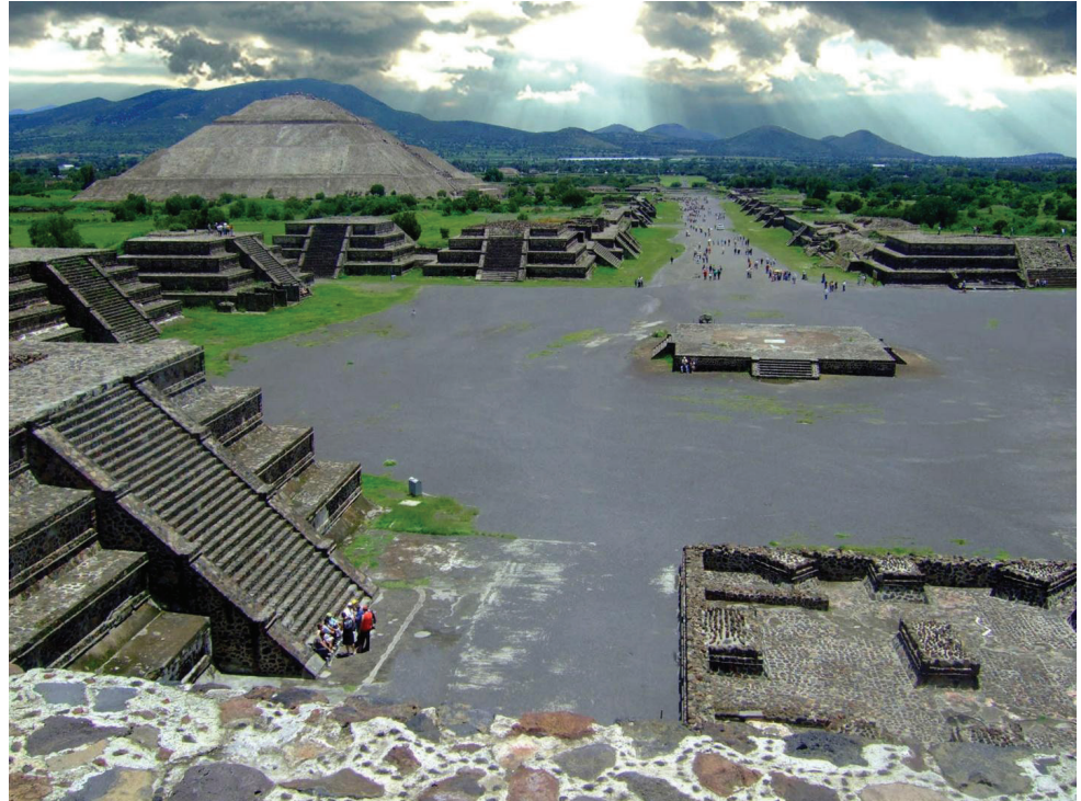
Figura 4. Sitio Arqueológico de Teotihuacán.

seos, como lo especifica el ICOM-UNESCO 8 : Investigación, conservación, divulgación y puesta en valor del objeto que lo constituye, sin embargo para exponerlos al público han de ser investigados y aprobados desde diferentes disciplinas, para garantizar la conservación, prever la capacidad de carga, establecer lineamientos de operación, control y manejo, así como la adecuada musealización con el fin de hacerlos visitables.