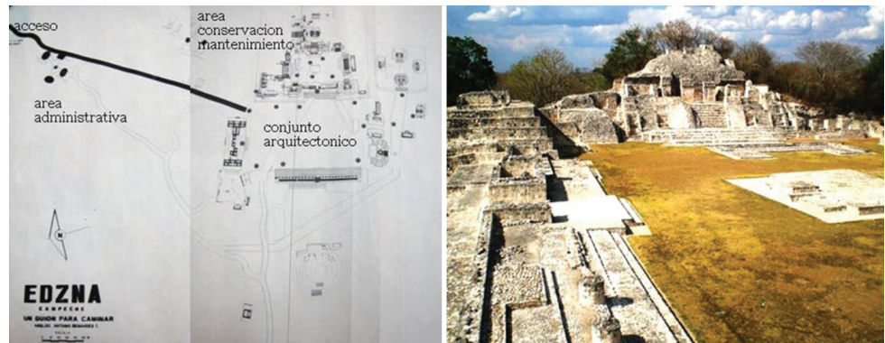
Figura 9. Sitio Arqueológico de Edzná. Conjunto poligonal y vista de la Gran Acrópolis (Fuente: Plano del INAH e imagen de Juan A. Vázquez).

plica para todo tipo de personas incluyendo a las de capacidades diferentes, servicios, higiénicos, áreas para sentarse, etc.