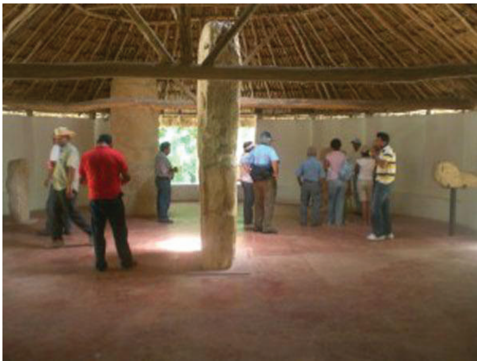
Figura 8. Sala de exposiciones de estelas mayas. Sitio Arqueológico de Edzná.

Indiscutiblemente los sitios arqueológicos de Campeche, se abrieron al público por la importancia y características singulares de cada uno de ellos, de acuerdo con la información arqueológica arrojada por los investigadores, variedad de estilos arqueológicos, cerámicas, estelas, tumbas, mascarones, entre otros, demuestran el grado de desarrollo y florecimiento que tuvieron estas ciudades, sin embargo aún estas rutas, no están consolidadas, y no presentan adecuada musealización con un equipamiento acorde a las normas básicas que le permitan al visitante interpretarlas.