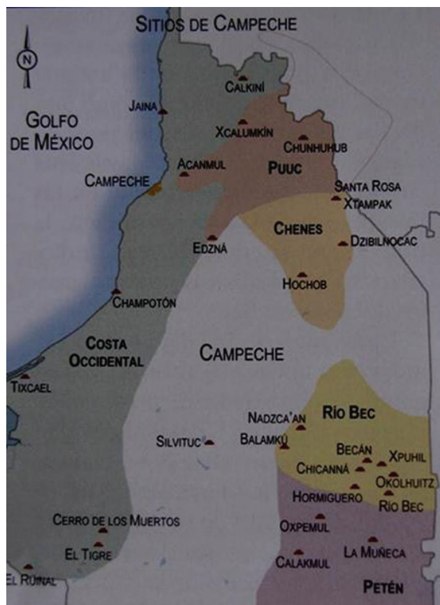
Figura 5. Plano de los sitios arqueológicos de Campeche y sus estilos arquitectónicos.

Existen otras tendencias y estilos arquitectónicos de menores dimensiones, como el denominado Río Bec, Chenes y Puuc. Las dos primeras predominan en el sur y oriente de Campeche durante los siglos VII a IX, cuando se produce el clímax poblacional y arquitectónico. (Figura 5)