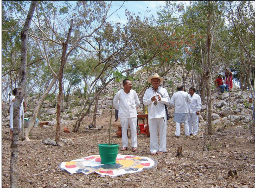
Figura 2. Ceremonia Maya. Puesta en valor del Parque arqueo ecológico Xoclán. (Fuente: Marisol Ordaz Tamayo).