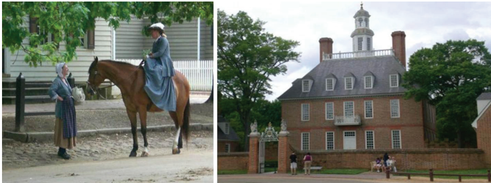
Figura 1. Williamsburg, modelo museístico. Modelo clásico de restitución en sitio.

En la actualidad con la apertura de nuevos museos apareció también la musealización, como una tendencia actual para mejorar el conocimiento e interpretación en los diferentes tipos de museos incluyendo a los sitios arqueológicos como nuevos museos fuera de muros. La musealización es una nueva forma de concebir a los museos, “es la puesta en valor del patrimonio (tangible o intangible) a través de la aplicación de un método.” 5