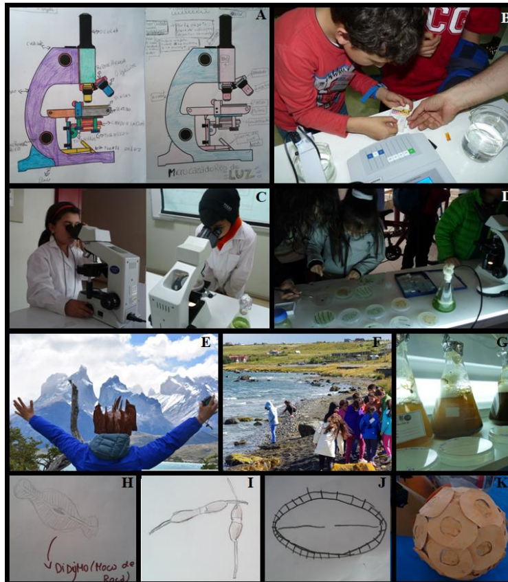
Figura 4. Evidencias de algunas de las actividades realizadas por los niños en el taller Microcazadores de Luz. A: Partes del microscopio. B: Determinación de pH. C: Manejo del microscopio. D: socialización de lo aprendido con sus padres y apoderados. E: Torres del Paine. F: Canal Señoret. G: Laboratorio microalgas Instituto de la Patagonia. Dibujos y modelos de las microalgas observadas, H: Didymosphenia geminata , I: Nitzschia , J: Cocconeis y K: Emiliana .