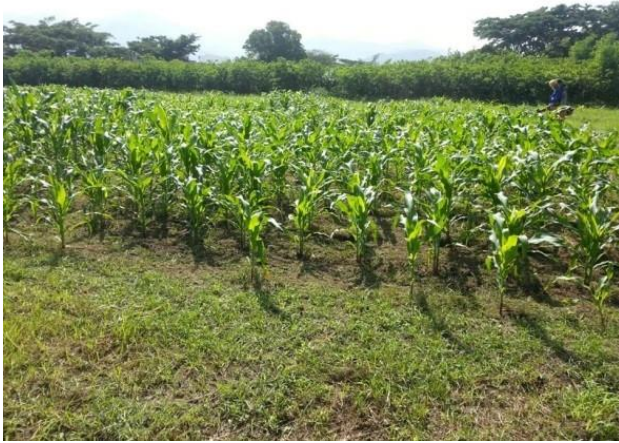
Figura 1. Lote de maíz híbrido Synko en centro de desarrollo agrícola y forestal de la Universidad del Magdalena en Santa Marta, Colombia.

y 20 días posterior a la siembra, utilizando una bomba de espalda con capacidad de 20 L, las aplicaciones se hicieron entre las 6:00 t 7:00 am. Se realizó un mejorado, un mojado completo del cogollo de la planta por hileras hasta cubrir el lote, luego se efectuó una segunda aplicación ocho días después. Lo anterior, con el fin de no inactivar el producto por los rayos solares y coincidir con la hora de ingestión de las larvas (figura 1).