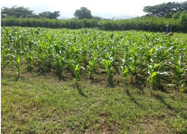
Figura 1. Lote de maíz híbrido Synko en centro de desarrollo agrícola y forestal de la Universidad del Magdalena en Santa Marta, Colombia.

días después de la siembra con 80 g de Bacillus thuringiensis y 24 cc de Carrier diluidos en una bomba de espalda con capacidad de 20 L, la mezcla se aplicó entre 6:00 y 7:00 am, se realizó un mojado completo del cogollo de la planta por hileras hasta cubrir el lote, luego se realizó una segunda aplicación 8 días después. Lo anterior con el fin de no inactivar el producto por los rayos solares y coincidir con la hora de ingestión de las larvas (figura 1).