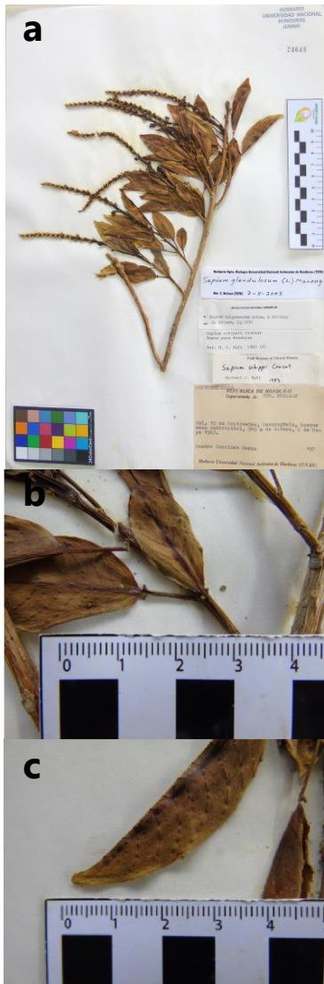
Figura 2. Sapium glandulosum . Inflorescencias terminales solitarias (a), glándulas peciolares (b) y glándulas en el margen (c); S.C. Cerna 97(TEFH).

Hábitat y distribución: México a Brasil y en las Antillas Menores. Bosque húmedo y muy húmedo, de 50-1,300 m.s.n.m. En Honduras, en bosque húmedo subtropical, hasta 1,100