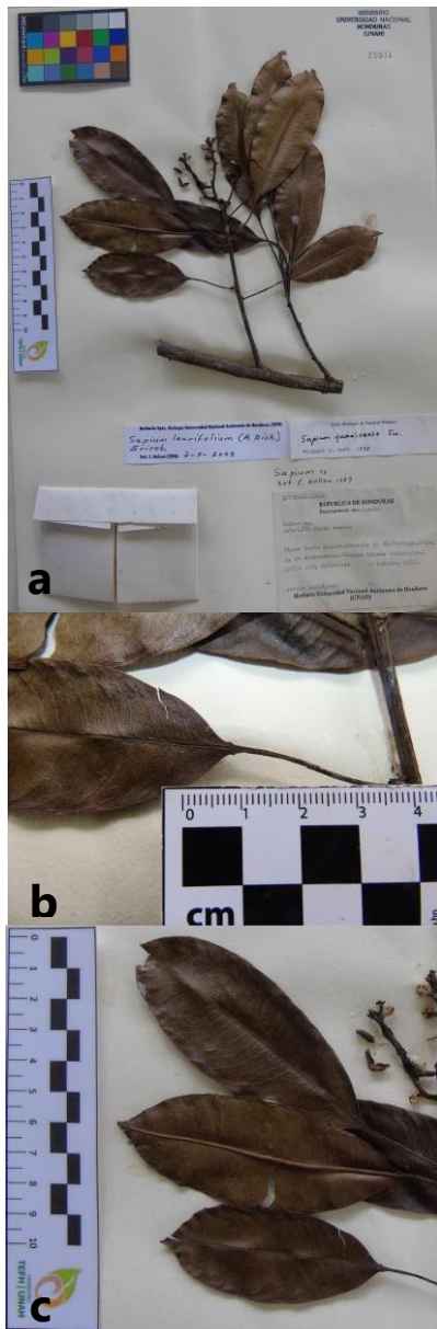
Figura 3. Sapium laurifolium . Inflorescencias terminales en grupos (a), pecíolos sin glándulas (b) y nervios secundarios numerosos, 15-30 (c), Sergio Rodríguez 21 (TEFH).

Comentarios: en esta especie las inflorescencias son terminales y agrupadas al final de las ramitas, tal como se muestra en la figura 3a (solitarias en S. glandulosum y S. macrocarpum ). La especie, además, se reconoce porque sus pecíolos a veces no presentan glándulas (figura 3b), las hojas son usualmente enteras, con nervios secundarios numerosos (figura 3c), y los frutos son longitudinalmente trisurcados y cortamente pedunculados a séssiles.