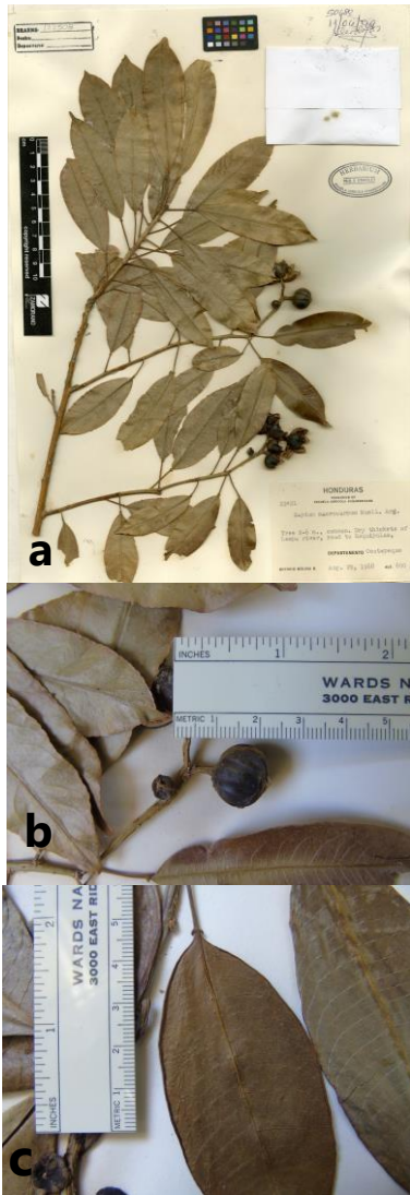
Figura 4. Sapium macrocarpum . Inflorescencias terminales solitarias (a), frutos pedicelados (b); A. Molina 22421 (EAP) y margen revoluto (c), A. Molina 10092 (EAP).

Fenología: florece en mayo y julio, y fructifica de mayo a noviembre.