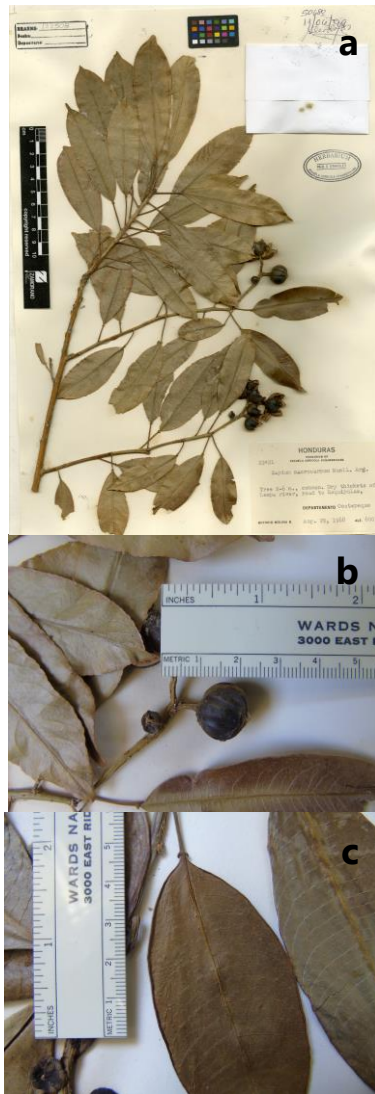
Figura 4. Sapium macrocarpum . Inflorescencias terminales solitarias (a), frutos pedicelados (b); A. Molina 22421 (EAP) y margen revuelto (c), A. Molina 10092 (EAP).

Fenología: florece en mayo y julio, fructifica de mayo a noviembre.