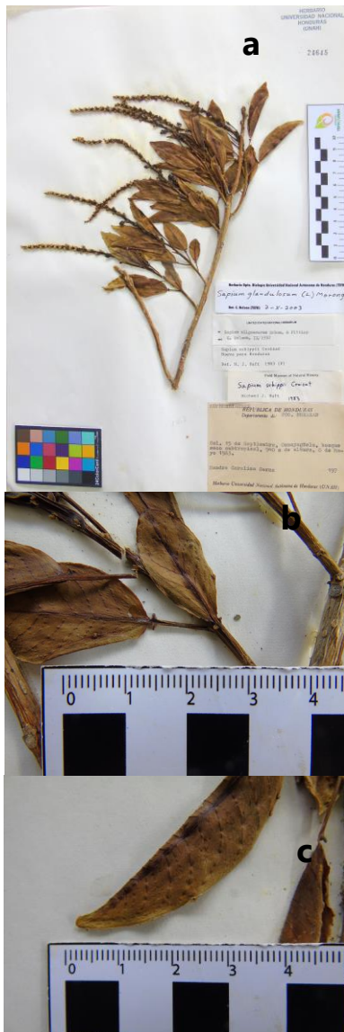
Figura 2. Sapium glandulosum . Inflorescencias terminales solitarias (a), glándulas peciolares (b) y glándulas en el margen (c); S.C. Cerna 97(TEFH).

Hábitat y distribución: México a Brasil y en las Antillas Menores. Bosque húmedo y muy húmedo, de 50-1300