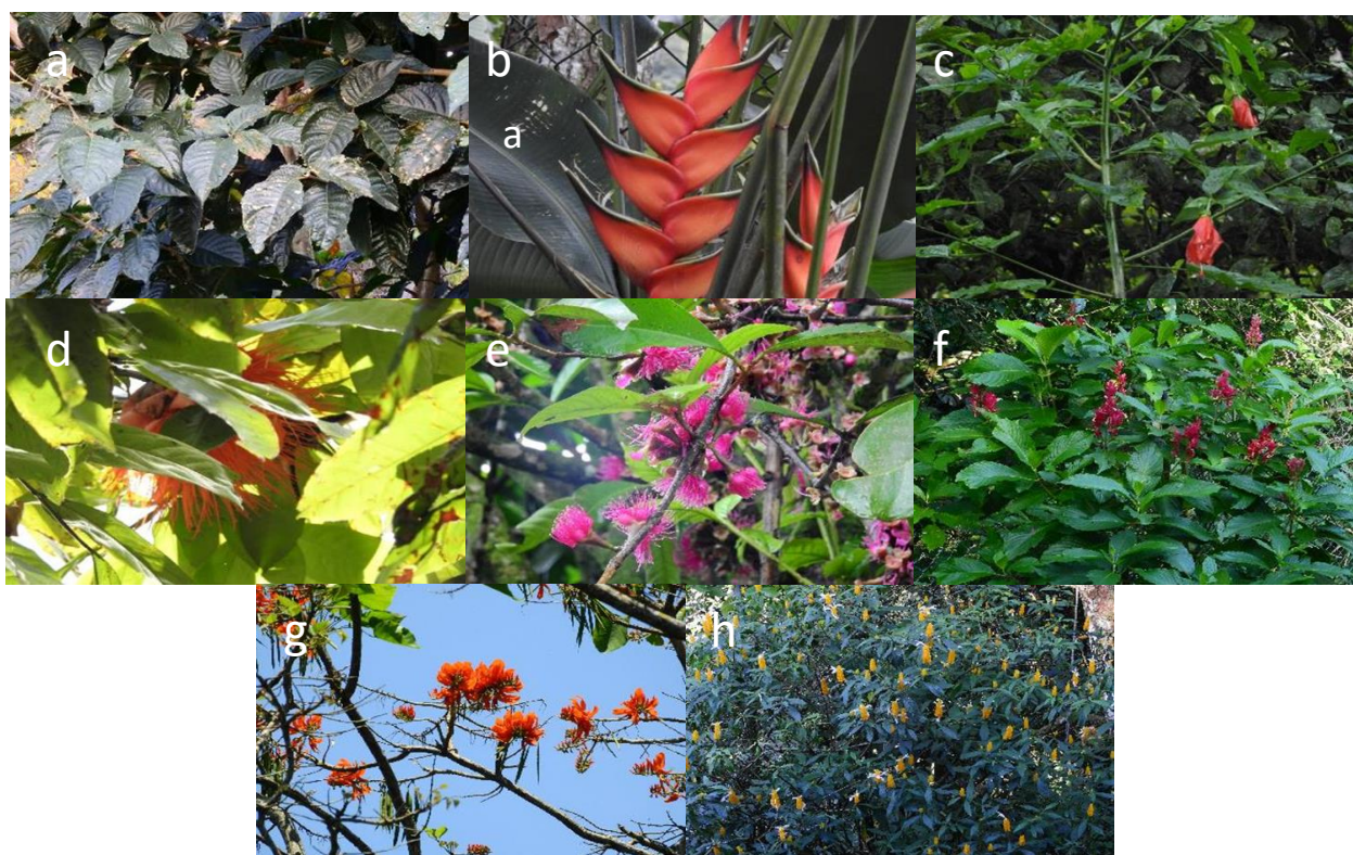
Figura 3. Especies de plantas visitadas por el colibrí de Buffon ( Chalybura buffonii caeruleogaster ) en sectores del piedemonte llanero, municipio de Villavicencio-Meta: a) Trichanthera gigantea , b) Heliconia sp., c) Malvaviscus arboreus , d) Brownea ariza , e) Syzygium malaccense , f) Megaskepasma erythrochlamys , g) Pachystachys lutea , h) Erythrina poeppigiana .

La abundancia de los colibrís puede verse influenciada por varios factores ambientales como la estructura del hábitat, las condiciones climáticas y la disponibilidad de los recursos alimentarios (Partida et al. , 2012), y también cabe considerar las épocas de migración o los movimientos locales de las poblaciones (Rappole y Schuchmann, 2003). De cualquier forma, una posible explicación de la baja abundancia del colibrí de Buffon en el área de estudio puede ser la presencia de 17 especies de trochilidos (Peñuela-Díaz, 2017), con las cuales comparte recursos, principalmente de los bosques, bordes de bosque de ribera, entre otros, lo que lo lleva a utilizar la vegetación de tipo arvense de los tejidos urbanos discontinuos, similar a lo documentado por Schuchmann (1999)