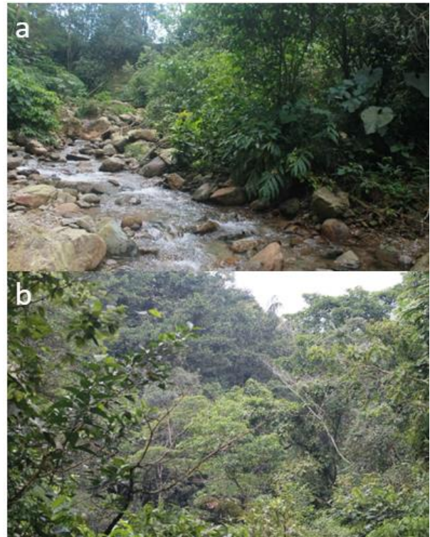
Figura 1. Coberturas presentes en el área muestreada en sectores del piedemonte llanero, municipio de Villavicencio-Meta, a) bosque de galería; b) bosque abierto alto.

El área muestreada se ubicó en la ecorregión de piedemonte llanero en dos sectores: El Carmen (04°08'N 73°39'W) y Buenavista (04°10'N 73°40'W), del municipio de Villavicencio, Meta, y cada uno cubrió un bloque de área de 300 ha. Estos sectores se encuentran en una altitud de entre 740 y 1 260 m, que corresponde a la formación de bosque húmedo tropical (Stile, 1980; Holdridge, 1996), y presentan formaciones vegetales ribereñas (figura 1) ( ej. , bosques riparios), que se caracterizan por la presencia de especies arbóreas como Pourouma guianensis , Rinorea macrocarpa y Cassia moschata y pastizales de Melinis minutiflora y de Paspalum carinatum (Rangel-Ch y Minorta-Cely, 2014). Cada bloque de área muestreado se caracterizó por ser presentar un mosaico de coberturas, que incluyen fragmentos de bosque, bosques riparios, en buen estado de conservación, pastizales, áreas urbanas y rurales, como las más importantes (Rangel-Ch, 2015).