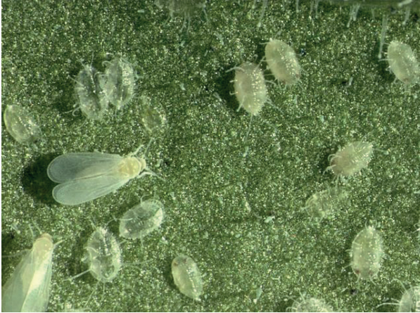
Figura 3. Adultos y ninfas de T. vaporariorum en hoja de pimiento.

Con los monitoreos preliberación, se determinó que eran necesarias dos liberaciones controladas de adultos y de larvas de C. argentina en las respectivas parcelas de MTr. Los adultos y larvas de C. argentina que se liberaron en el cultivo de pimiento provenían de una cría masiva realizada en cámaras del Centro de Investigaciones para la Regulación de Poblaciones de Organismos Nocivos (CIRPON), de Tucumán.