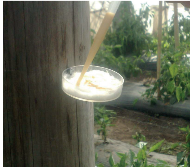
Figura 4. Método de liberación de C. argentina considerado en el estudio.

liberación se realizó el 10/12. En ambos muestreos, posteriores a la liberación, se eligieron 10 plantas al azar por cada parcela de 20 plantas. Se realizó la transformación logarítmica de los datos, análisis de la varianza y prueba t.