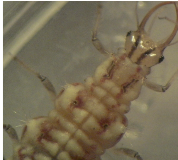
Figura 5. Chrysoperla argentina en su tercer estadio larval. El protorax con dos bandas laterodorsales delgadas de color pardo rojizo es un carácter morfológico de valor taxonómico.