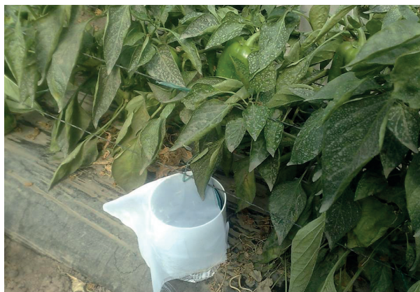
Figura 6. Estrategia utilizada como atrayente para C. argentina .