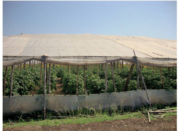
Figura 1. Invernáculo tipo parral de Almería con cultivo de pimiento ( C. annuum ) en Tucumán, Argentina.

22/11, 29/11 y 10/12 (Figura 2). Se registró el número de adultos de mosca blanca por estrato (inferior, medio, superior) de planta. Cabe aclarar que se incluyó a C. argentina en los monitoreos preliberación porque al tratarse de una especie nativa cabía la posibilidad de que esté presente naturalmente en el cultivo, pudiendo esto interferir en el resultado de las liberaciones controladas de individuos de esta misma especie.