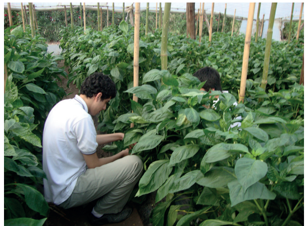
Figura 2. Monitoreo de T. vaporariorum en cultivo de pimiento bajo invernáculo.

Las liberaciones controladas de C. argentina se realizaron en las parcelas seleccionadas de MTr cuando el número de individuos de T. vaporariorum (Figura 3) por planta superó el umbral de daño económico, > 50 adultos por planta, basados en los resultados expuestos por Bellotti et al. (2007).