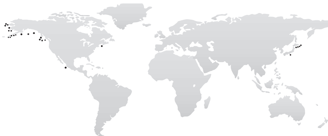
Figura 1. Distribución de Stephanopyxis nipponica .

y Argot) Ralfs 1861, en regiones templadas a subtropicales y S. nipponica (Ehrenb.) Ehrenb, con distribución en aguas templadas, frías a árticas en el Pacífico norte este y oeste: Mar de Bering, Estrecho de Bering, Golfo de Alaska, costa oeste de Canadá, Golfo de California y aguas de Japón y en el Atlántico en la costa este de los Estados Unidos (Cupp, 1943; Marshall, 1976; Hernández-Becerril, 1987; Hasle y Syvertsen, 1996; Moreno et al., 1996) (Figura 1).