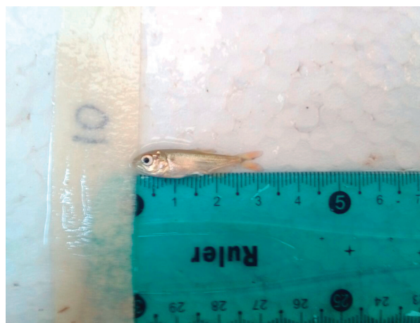
Figura 1. Fotografía de alevino de Yamú ( Brycon siebenthalae ), aparentemente sano.

Los monogeneos están distribuidos por todo Suramérica y afectan la gran mayoría de peces en los diferentes sistemas productivos (Valladão et al., 2016). El objetivo del trabajo es reportar el diagnóstico clínico de monogeneos branquiales en alevinos de tilapia roja ( Oreochromis spp. ) y yamú ( Brycon siebenthalae ) producidos bajo sistema intensivo (BFT) (figura 1), en los municipios de Arauca y Arauquita, del departamento de Arauca.