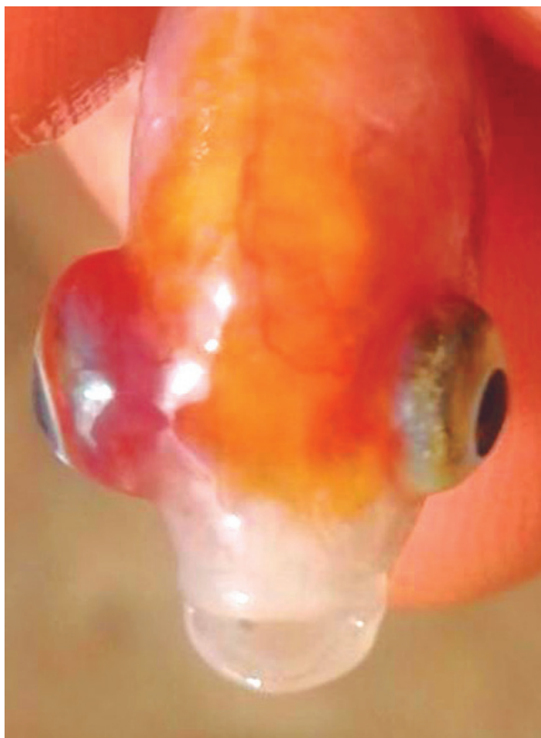
Figura 2. Tilapia roja ( Oreochromis spp.) presentando exoftalmia bilateral marcada.

Transcurrido cinco días posteriores al inicio del experimento se reportaron mortalidades. Se procedió a evaluar los parámetros de calidad de agua, OD y T con sonda YSI® DO200 y pH con tester Hanna® 98128, Se cuantificó \text{NH}_4 con tiras reactivas y los SD con cono Imhoff. Se inspeccionó semiológicamente mediante observación directa de alevinos vivos al microscopio (4x), evaluación comportamental y sobrevivencia. Los parámetros de calidad de agua en los dos casos se encontraron dentro de los rangos ideales para la producción de tilapia roja y yamú, implementando tecnología biofloc, el único parámetro que se encontró disminuido fue los sólidos decantables SD en tilapia roja (tabla 1).