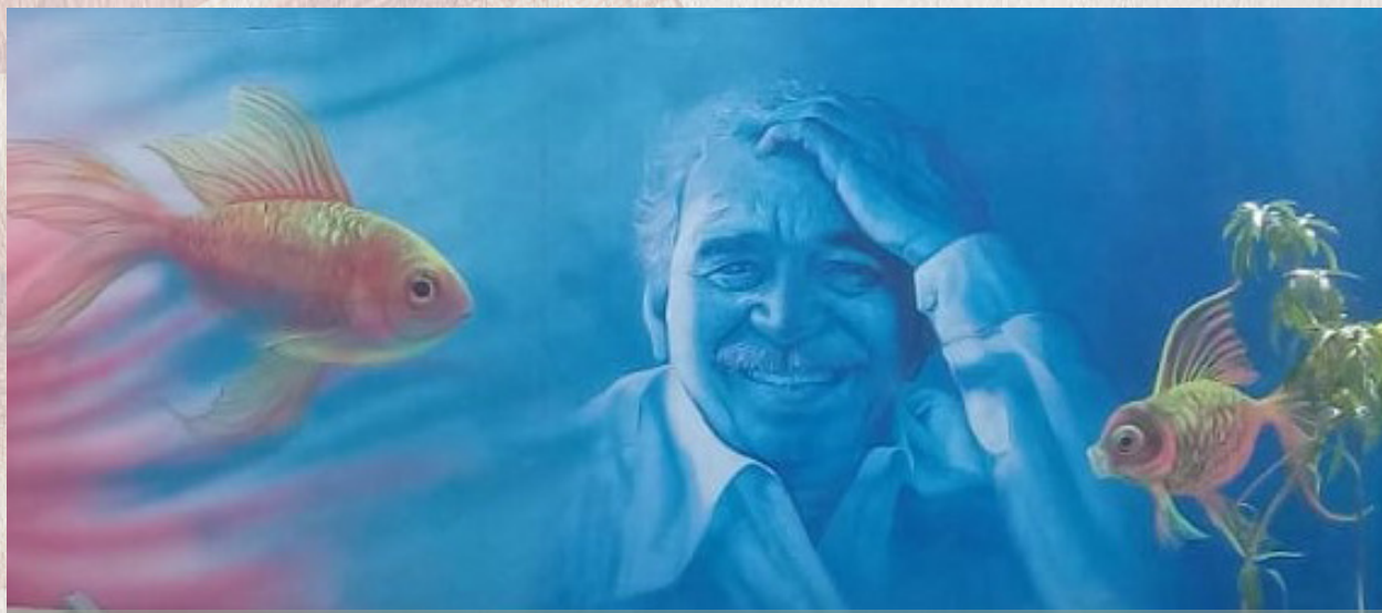
Fotografía Mural municipio de Aracataca

Gabo un gran escritor, que con sus letras a todo un mundo conquistó, Pero siempre llevó presente a Macondo en su corazón.