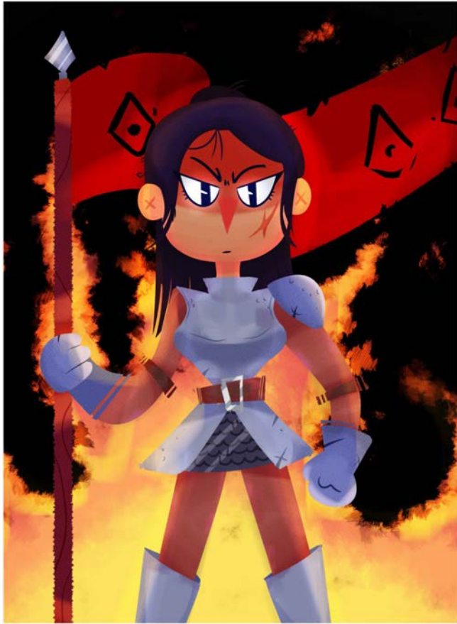
Ilustración 'Guerrera' Cristian Manjarres Herrera