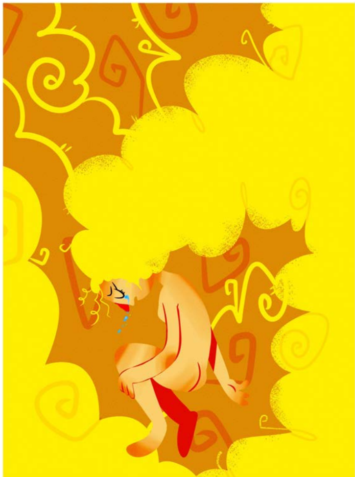
Ilustración 'Humo' Cristian Manjarres Herrera