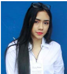
Estudiante Programa de Enfermería

Gracias a las entrevistas realizadas a los estudiantes de la Universidad del Magdalena con la pregunta: ¿qué es la acreditación de alta calidad?, nos pudimos dar cuenta que muy pocos son los estudiantes que tienen claro su significado. Entonces, ¿qué es la acreditación de alta calidad? Es un reconocimiento público que se le hace a aquellas instituciones de Educación Superior a las que se les ha comprobado, mediante un ejercicio de evaluación interna y externa, que cumplen con las condiciones de alta calidad como son: la excelencia en los programas académicos, su organización y funcionamiento y el cumplimiento de sus funciones sociales, y la Universidad del Magdalena cuenta con tal reconocimiento.