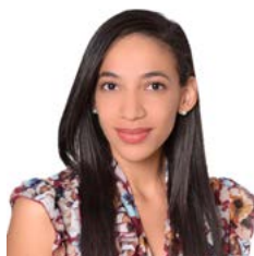
Egresada Programa de Derecho