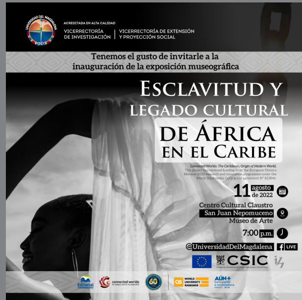
Banner publicitario de la exposición museográfica.