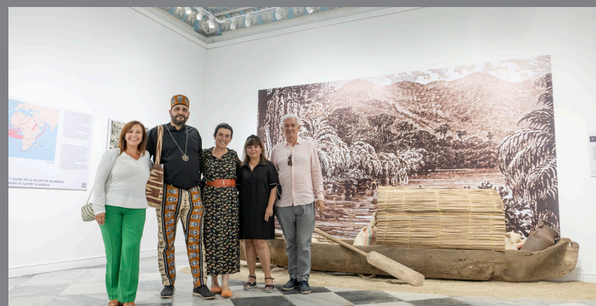
Miembros del proyecto Connected Worlds: The Caribbean, Origin of Modern World, el CSIC, el IS y Ediciones Doce Calles, durante la exposición museográfica.