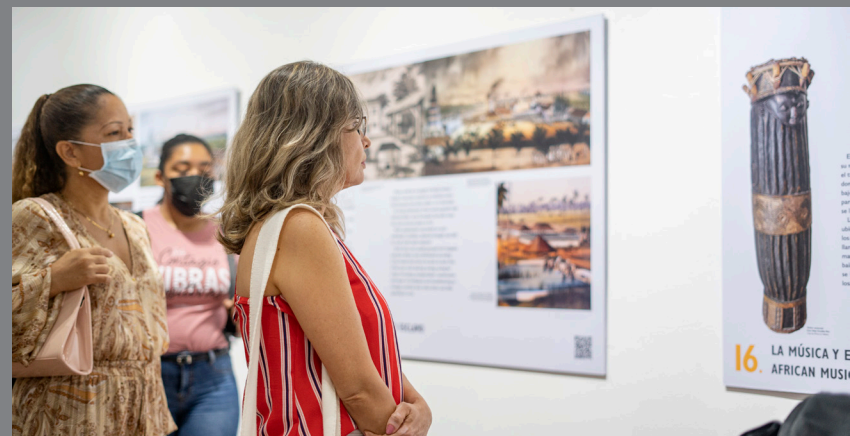
Visitantes a la exposición museográfica