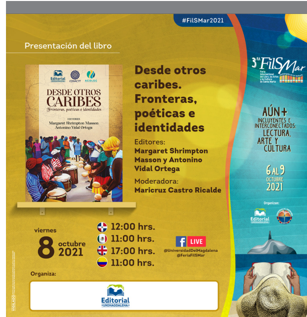
Banner publicitario del evento en la FilSMar 2021.

El lanzamiento de la obra se desarrolló dentro del marco de la Feria Internacional del Libro, las Artes y la Cultura de Santa Marta FilSMar 2021 / 2da Edición virtual, en virtud de la jornada académica denominada: El Gran Caribe en los libros: historias e historiografías. Segunda jornada.