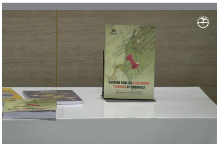
Exposición de la obra durante el evento realizado en el auditorio Playa Grande de la Universidad del Magdalena.

La presentación del libro como novedad editorial se desarrolló dentro del marco de la Feria Internacional del Libro, las Artes y la Cultura de Santa Marta FilSMar 2021 / 2da Edición virtual.