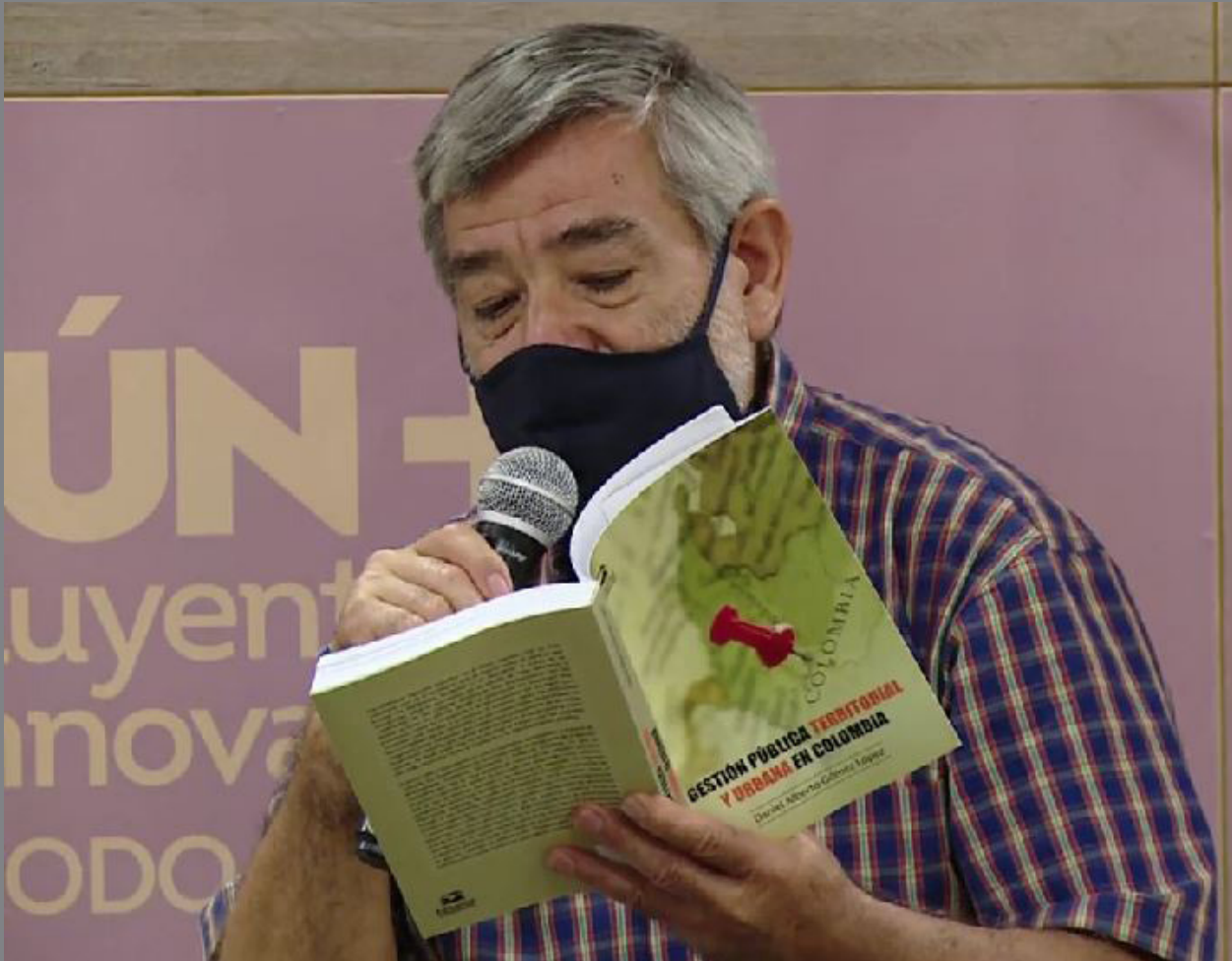
Intervención del autor durante el lanzamiento del libro.