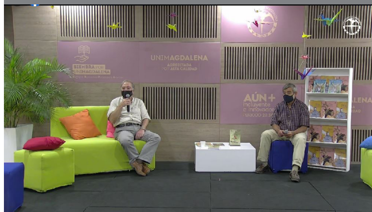
El autor y moderador durante el evento en la FilSMar 2021.