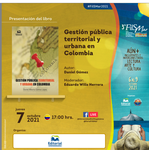
Banner del lanzamiento del libro.