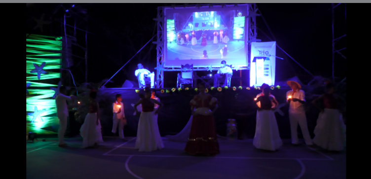
Muestra cultural durante el lanzamiento de la obra.