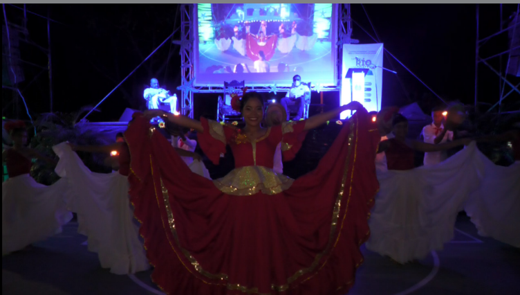
Bailarina del grupo de danza que amenizó el evento.