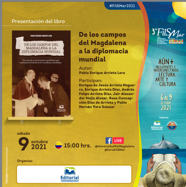
Banner publicitario del lanzamiento del libro en la FilSMar 2021.

El lanzamiento de la obra como novedad editorial se desarrolló dentro del marco de la Feria Internacional del Libro, las Artes y la Cultura de Santa Marta FilSMar 2021 / 2da Edición virtual.