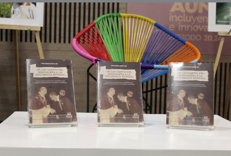
Exposición de la obra durante su lanzamiento como novedad editorial.