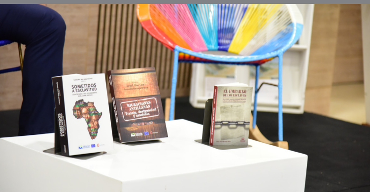
Exposición de la obra en el auditorio Neguanje de la Universidad el Magdalena.