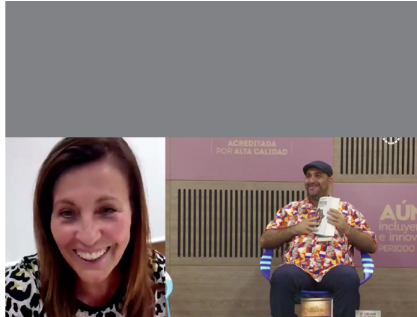
Conversación entre la editora (conectada desde España a través de la plataforma Zoom) y el moderador (desde el Set de presentaciones en el auditorio Neguanje de la Universidad del Magdalena).