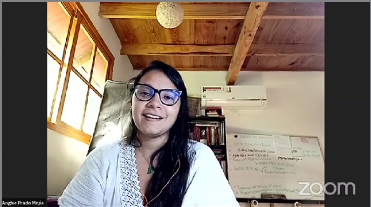
La autora durante la presentación del libro en la FilSMar 2021.