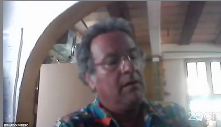
Intervención del moderador durante el evento (conectado a través de la plataforma Zoom).