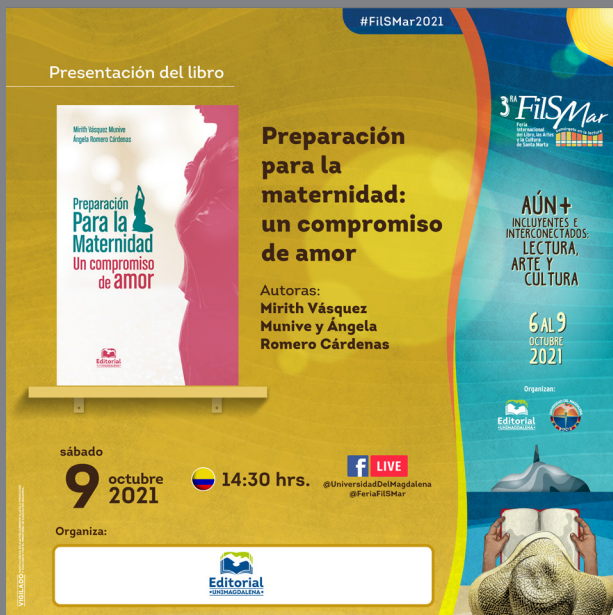
Banner publicitario del evento.

La presentación del libro se desarrolló dentro del marco de la Feria Internacional del Libro, las Artes y la Cultura de Santa Marta FilSMar 2021 / 2.ª Edición virtual, en virtud de la actividad académica denominada: La salud en los libros. A este encuentro virtual asistió público general y especializado en Ciencias de la Salud, docentes y estudiantes, espacio en el que las autoras, realizaron un conversatorio sobre el contenido, enfoque e impacto de la obra, asimismo, relataron el proceso de elaboración del libro.