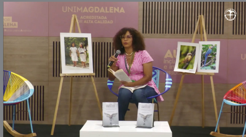
Intervención de la autora durante el lanzamiento de la obra.