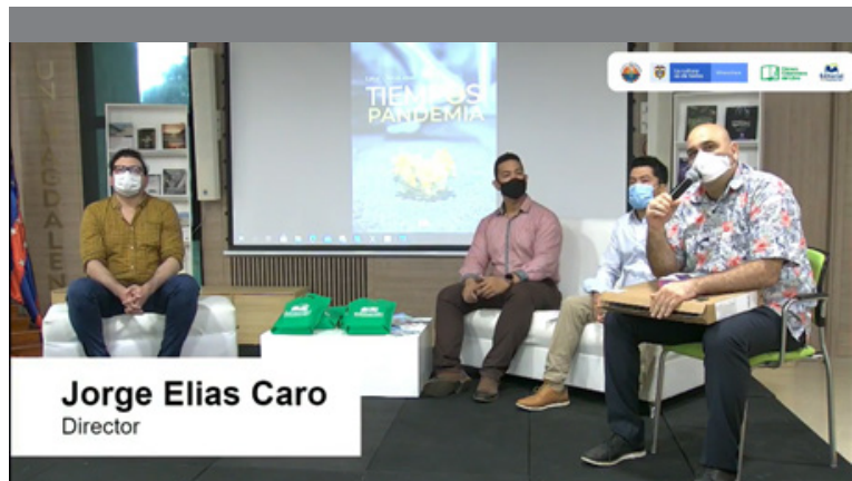
Instalación del evento de premiación por el coordinador de publicaciones y fomento editorial.