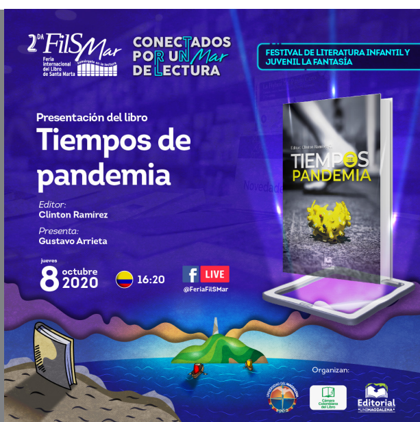
Banner del lanzamiento del libro en la FilSMar 2020.