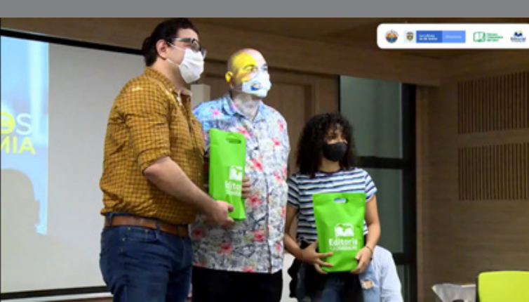
Foto de dos de los cuentistas premiados junto al coordinador de publicaciones y fomento editorial, en el acto de entrega de premios.