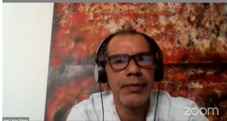
Invitado al lanzamiento del libro.