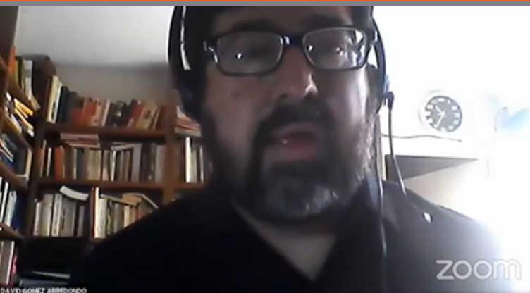
Participación de uno de los invitados al evento.