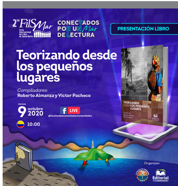
Banner publicitario del lanzamiento del libro en la FilSMar 2020.

El lanzamiento del libro como novedad editorial, se desarrolló en una sesión virtual dentro del marco de la Feria Internacional del Libro de Santa Marta FilSMar 2020 / 1.ª Edición virtual. A este encuentro asistió público general y especializado en antropología, docentes y estudiantes. Los compiladores en compañía de algunos autores, realizaron un conversatorio sobre el contenido, enfoque e impacto de la obra.