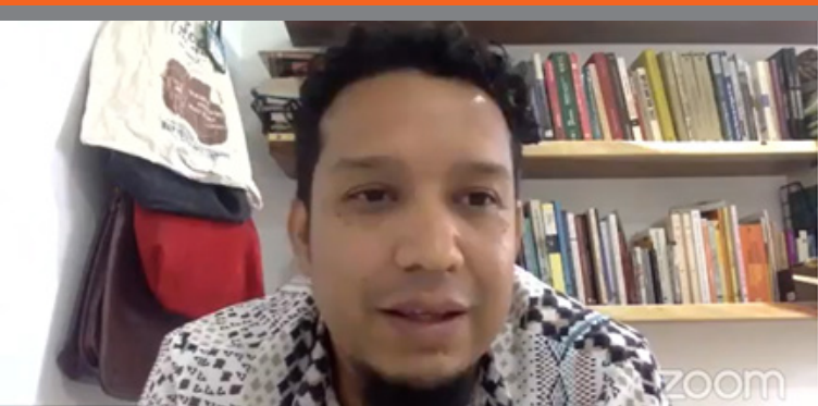
Intervención del autor y compilador del libro.