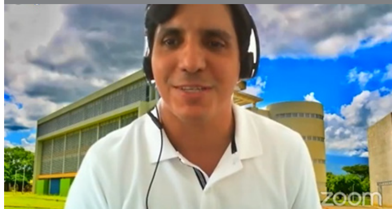
Intervención del moderador de la jornada académica durante el lanzamiento del libro.