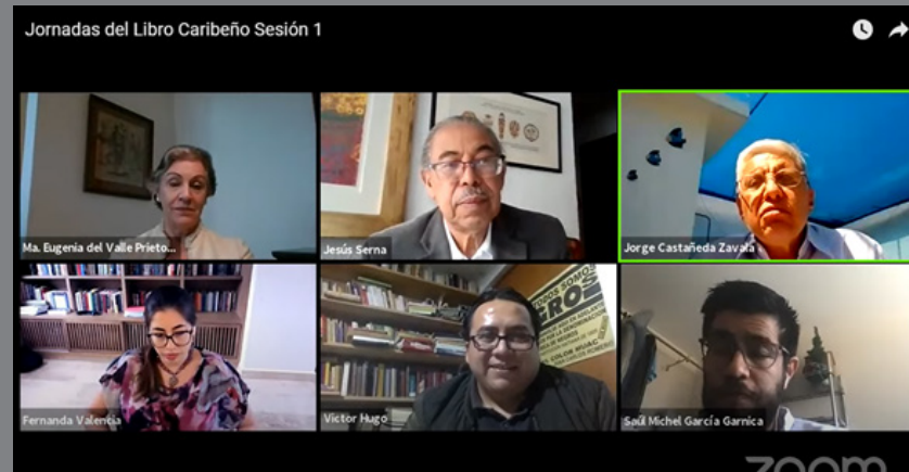
Proyección de la conexión múltiple a través de YouTube, entre los autores los participantes de la Jornada del Libro Caribeño Sesión 1.