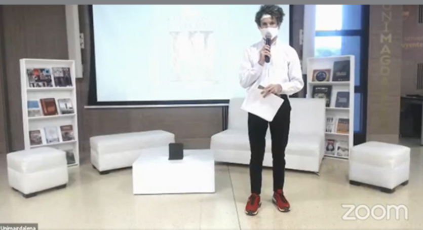
Presentación del libro desde el auditorio Playa Grande del edificio Mar Caribe de la Universidad del Magdalena.