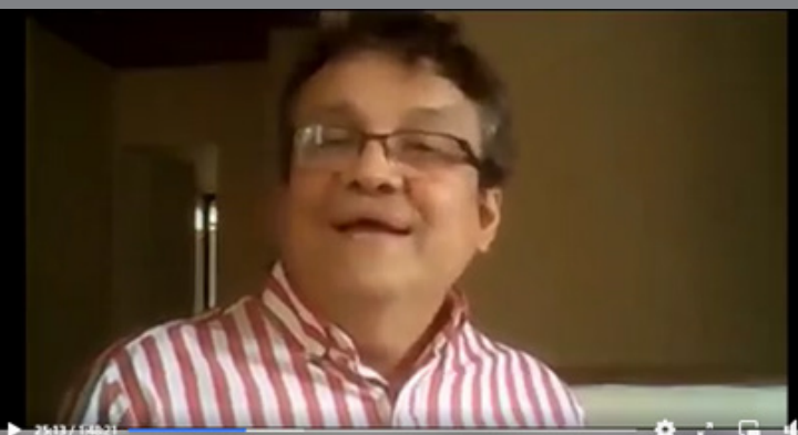
XXVIII FESTIVAL DE LITERATURA DE CÓRDOBA Y DEL CARIBE (DÍA 3)

Proyección de la conexión múltiple a través de YouTube, entre los autores y el coordinador de Publicaciones y Fomento Editorial de la Universidad del Magdalena.