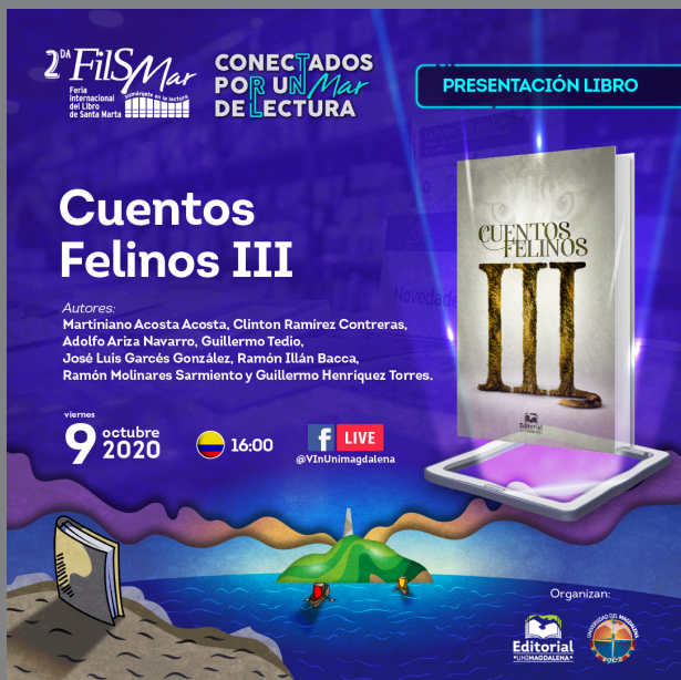
Banner publicitario de la presentación en la FilSMar 2020.