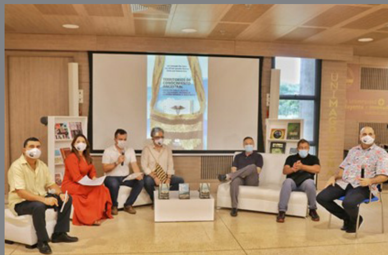
Los autores de la obra, moderadora de la presentación, presentador de la jornada y el coordinador de publicaciones y fomento editorial de la Editorial Unimagdalena y director de la FilSMar, desde el auditorio Playa Grande del edificio Mar Caribe de la Universidad del Magdalena, en el marco de la 2.ª versión de la Feria Internacional del Libro de Santa Marta – FilSMar 2020 / 1.ª Edición Virtual.