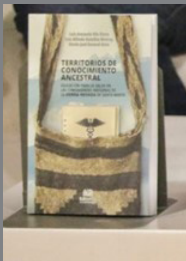
Exposición de la obra durante su presentación en virtud de la 2.ª versión de la Feria Internacional del Libro de Santa Marta – FilSMar 2020 / 1.ª Edición Virtual.