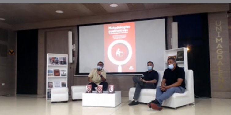
Los autores de la obra desde el auditorio Playa Grande del edificio Mar Caribe de la Universidad del Magdalena, en el marco de la 2.ª versión de la Feria Internacional del Libro de Santa Marta – FilSMar 2020 / 1.ª Edición Virtual.