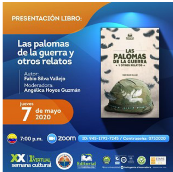
Banner publicitario del evento en el marco de la XX Semana Cultural 2020.

cerca el contenido de la obra, detalles importantes de la creación literaria, la motivación del autor para escribir el libro y el proceso editorial del mismo. A este encuentro virtual asistieron antropólogos, docentes y estudiantes, así como amantes de los libros y demás público en general.