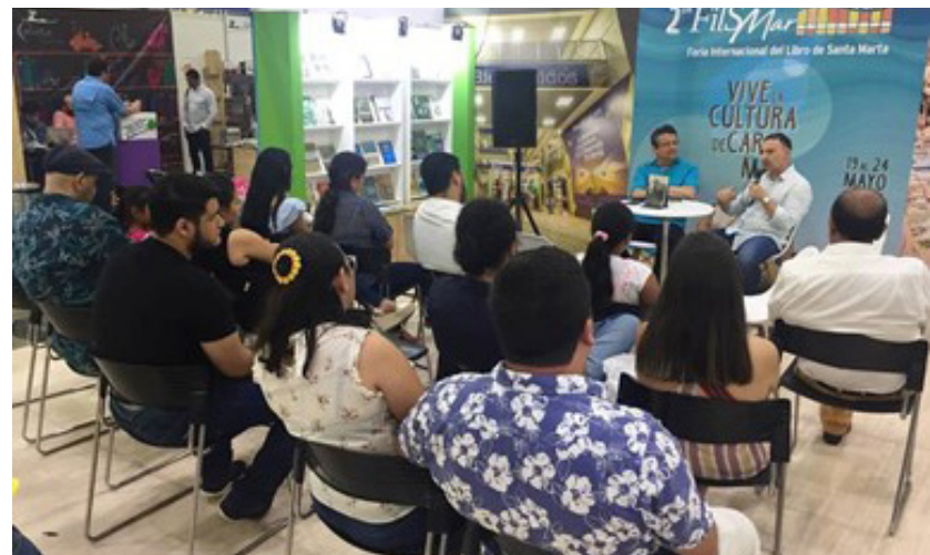
Público asistente a la presentación del libro en LIBRAQ 2019.