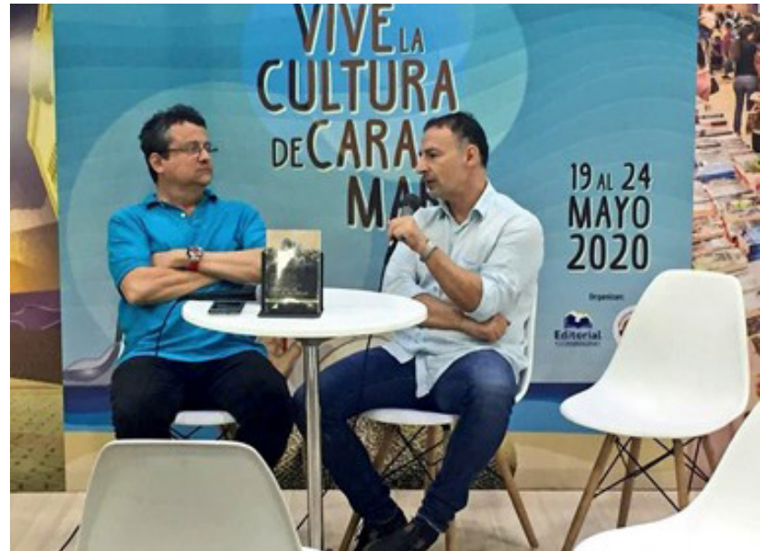
Presentación de la obra en la Feria Internacional del Libro de Barranquilla, LIBRAQ 2019.