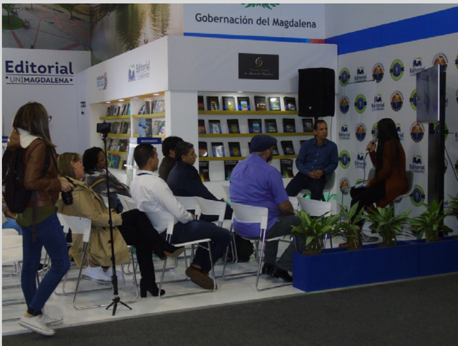
Figura 91. Público asistente a la presentación del libro