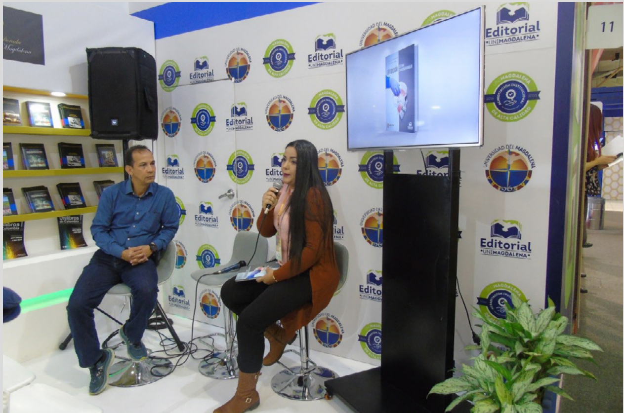
Figura 89. Presentación de la obra en Feria Internacional del Libro de Bogotá, FILBO 2019

Asimismo, la autora expresó: “Este texto es mi primer texto en odontología y para mí ha sido una experiencia muy enriquecedora porque en esta obra están plasmadas las actividades que se hacen en las aulas de clases, en la preclínica, en las clínicas. He tenido la oportunidad de revisar en la feria muchas editoriales y en odontología es muy poca la publicación existente y creo que debemos seguir incentivando a que los docentes del programa de Odontología puedan publicar”.