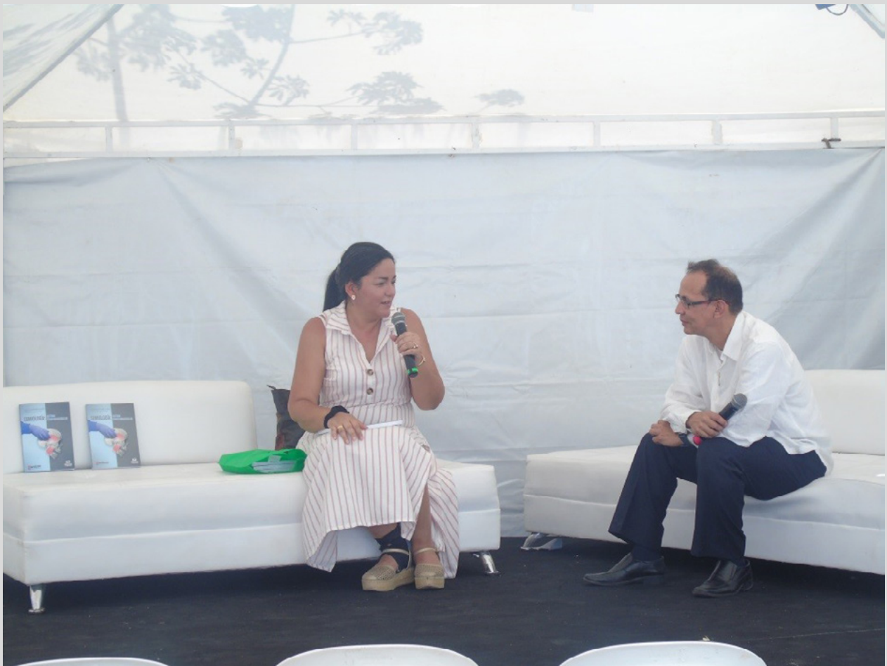
Figura 92. Presentación de la obra en la Feria del Libro de Santa Marta, 2019