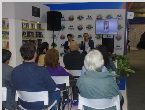
Figura 19. Lanzamiento del libro en la Feria Internacional del Libro de Bogotá, FILBO 2019