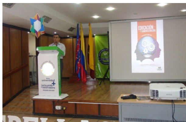
Figura 20. Presentación de la obra en la Feria del Libro de Santa Marta, 2019

La obra fue presentada en la Feria del Libro de Santa Marta, el 22 de mayo, en el auditorio Julio Otero en donde el autor realizó una charla con los temas más representativos de su obra (figura 20).