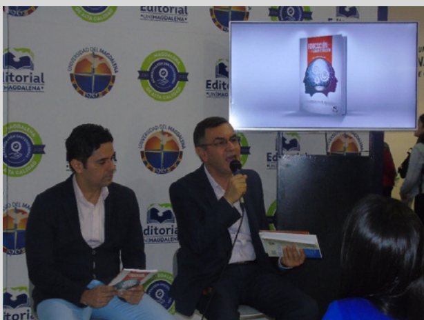
Figura 18. Lanzamiento del libro en la Feria Internacional del Libro de Bogotá, FILBO 2019

“Este libro tiene seis capítulos, son seis ensayos argumentativos que giran fundamentalmente alrededor de la educación, la administración, la globalización, las interdisciplinas, las disciplinas, las transdisciplinas, las organizaciones que aprenden y sobre inteligencias múltiples”.