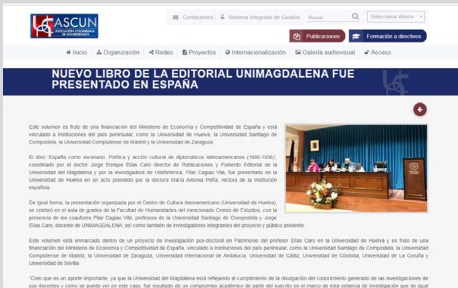
Figura 11. Publicación de ASCUN referente a la presentación del libro en la Universidad de Huelva 3