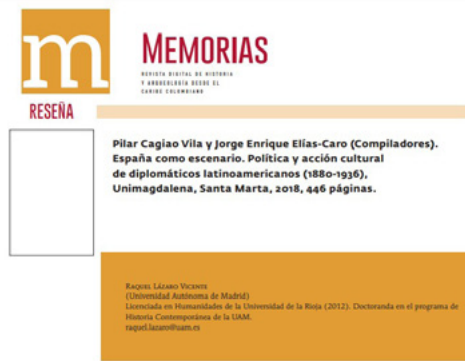
Reseña publicada en la edición No. 41 de la revista Memorias