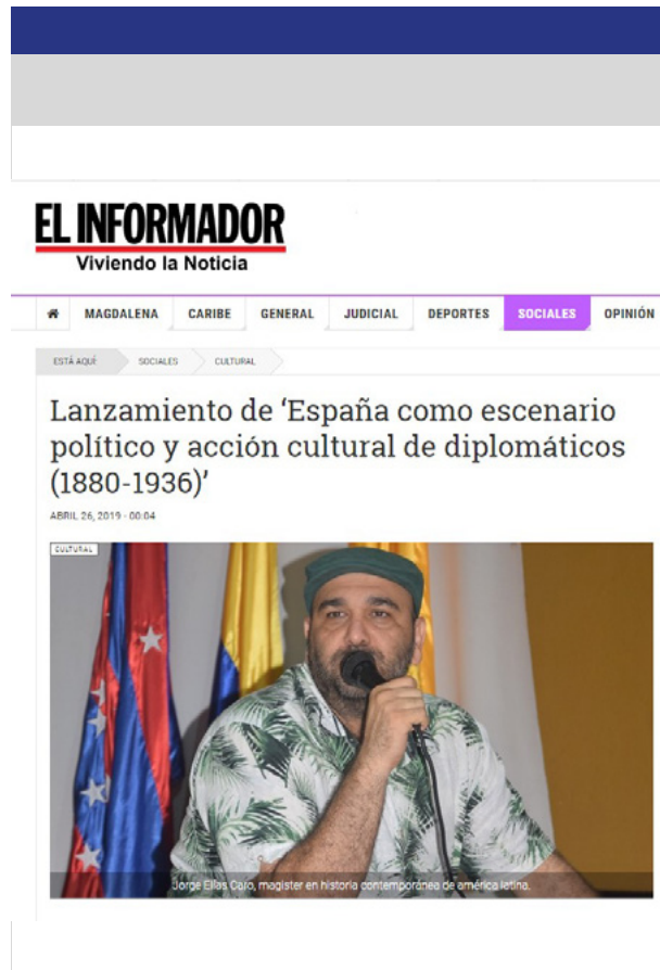
Figura 13. Artículo periodístico en el periódico El Informador 5