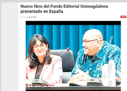
Figura 12. Artículo periodístico en Hoy Diario del Magdalena 4

Medios periodísticos escritos también resaltaron la publicación y presentación del libro en España (Figuras 12 y 13)