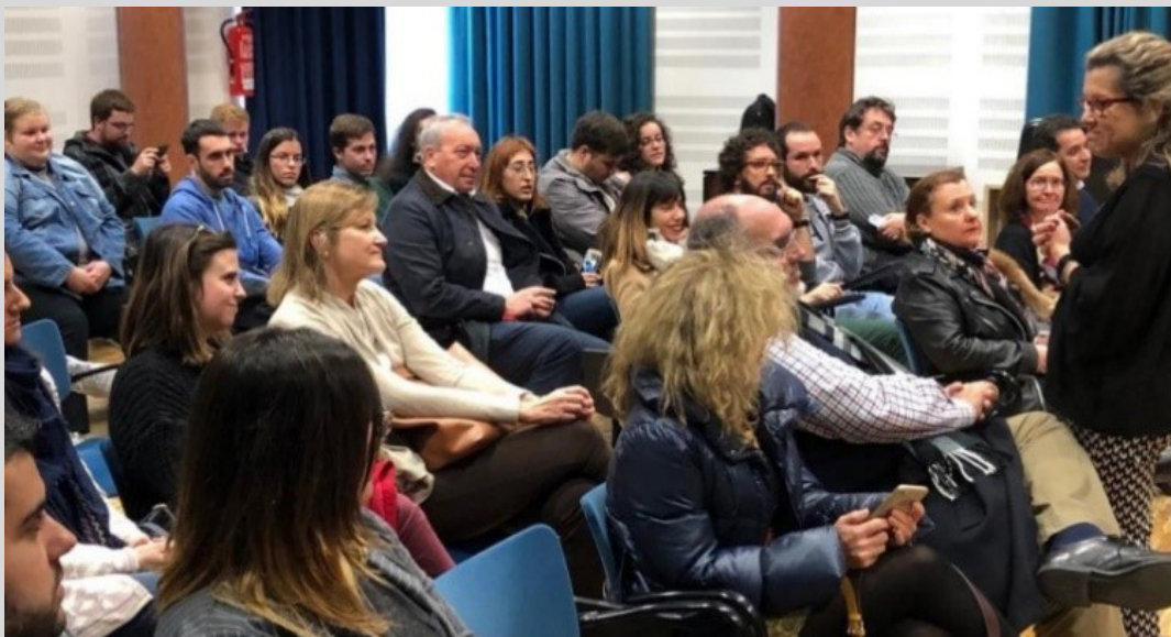
Figura 9. Público asistente a la presentación de la obra