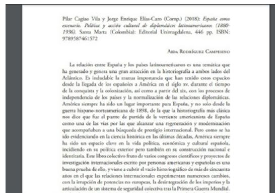
Reseña publicada en la edición No. 9 de la revista Erebea