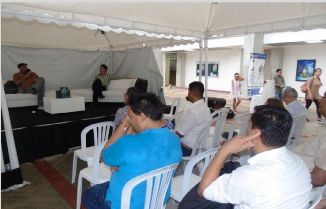
Figura 17. Público asistente a la presentación en la Feria del Libro de Santa Marta, 2019