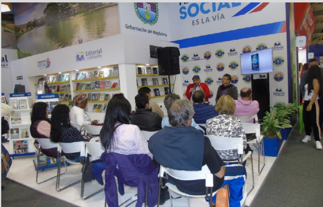
Figura 15. Público asistente a la presentación de la obra