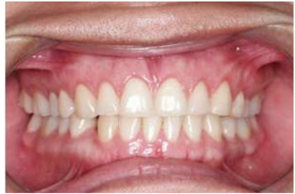
Figura 6. Postoperatorio.

Los parámetros estéticos son cruciales para un diagnóstico correcto y un adecuado plan de tratamiento.