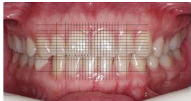
Figura 1.1. Análisis en computador