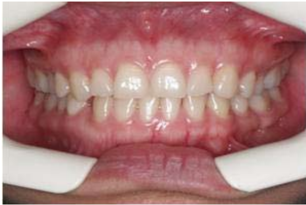
Figura 5. Preoperatorio.

permitirá ajustar el diseño de la nueva sonrisa y tener una mejor seguridad del trabajo realizado, dándole ubicación individualizada a cada punto cenit y a cada margen gingival. Figura 4.