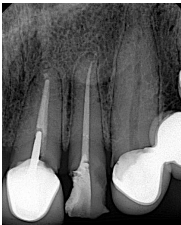
Figura 3. Radiografía final.