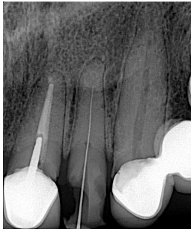
Figura 2. Comprobación permeabilidad o glide path .