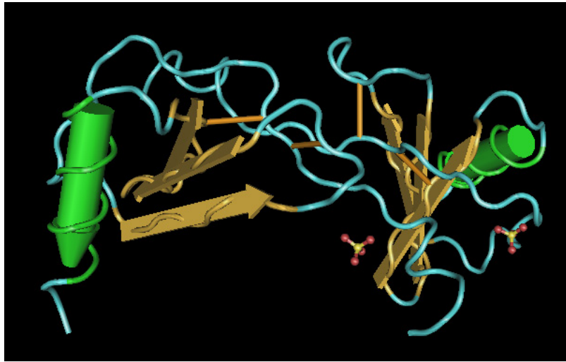
Figura 1. Estructura tridimensional de la proteína quimioatrayente de monocitos -1, forma P (Monocyte Chemoattractant Protein-1, P-form). La estructura cristalina de rayos X de MCP-1-P está refinada a una resolución de 1.85 Å y contiene una unidad de dímeros asimétricos. Tomado de: Lubkowski J, Bujacz G, Boqué L, Domaille PJ, Handel TM, Wlodawer A. The structure of MCP-1 in two crystal forms provides a rare example of variable quaternary interactions. Nat Struct Biol. 1997 Jan;4(1):64-9.