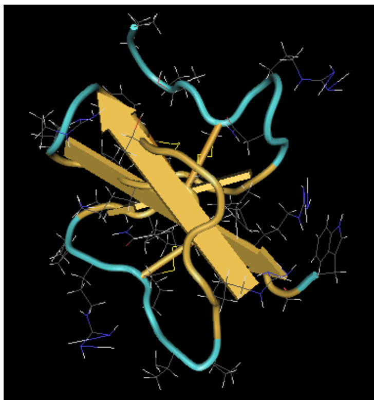
Figura 4. Estructura terciaria de la defensina humana beta 2.

Tomado de: http://www.ncbi.nlm.nih.gov/Structure/mmdb/mmdbsrv.cgi?uid=35490 . Vista con Cn3D V4.1. Acceso en Julio 10 de 2009.