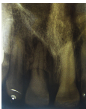
Figura 2. Se observa línea de fractura horizontal en el tercio medio con formación de cayo óseo y defecto en esa zona en la continuidad del ligamento periodontal; se observa calcificación generalizada en la cámara pulpar y permeabilidad en todo el trayecto del canal radicular con una lesión radiolúcida apical con pérdida de la continuidad del ligamento periodontal en la zona.

Refiere la paciente que a la edad de aproximadamente 9 años, sufrió trauma al caerse de su propia altura, ocasionándole grave herida en la frente y laceración en el labio. Comenta que recibió atención médica por la herida en la frente, más no así por la laceración en boca.