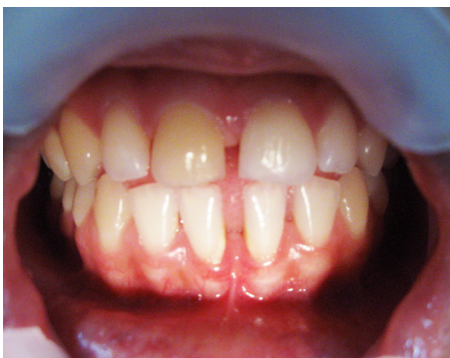
Figura 1. Cambio de color bastante notorio en el central superior derecho.

Paciente femenino de 22 años de edad, remitida al posgrado de endodoncia de la facultad de odontología de la Universidad de Cartagena, para valoración endodóntica por presentar cambio de color y zona radiolúcida periapical a nivel del central superior derecho (figura 1).