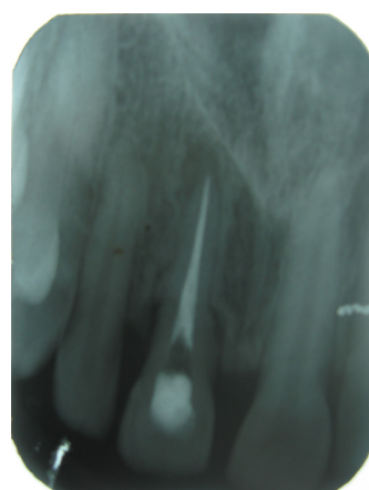
Figura 4. Se observa obturación definitiva bien definida del conducto radicular.