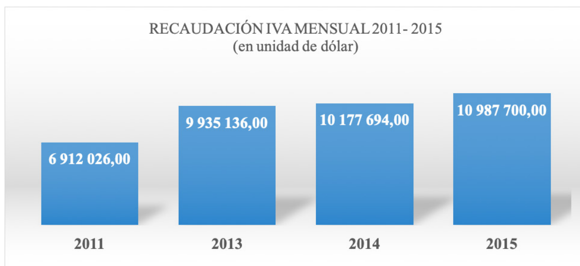
Figura 2. Recaudación IVA mensual período 2011-2015

Fuente: elaboración propia basada en los datos estadísticos obtenidos del SRI (2014).