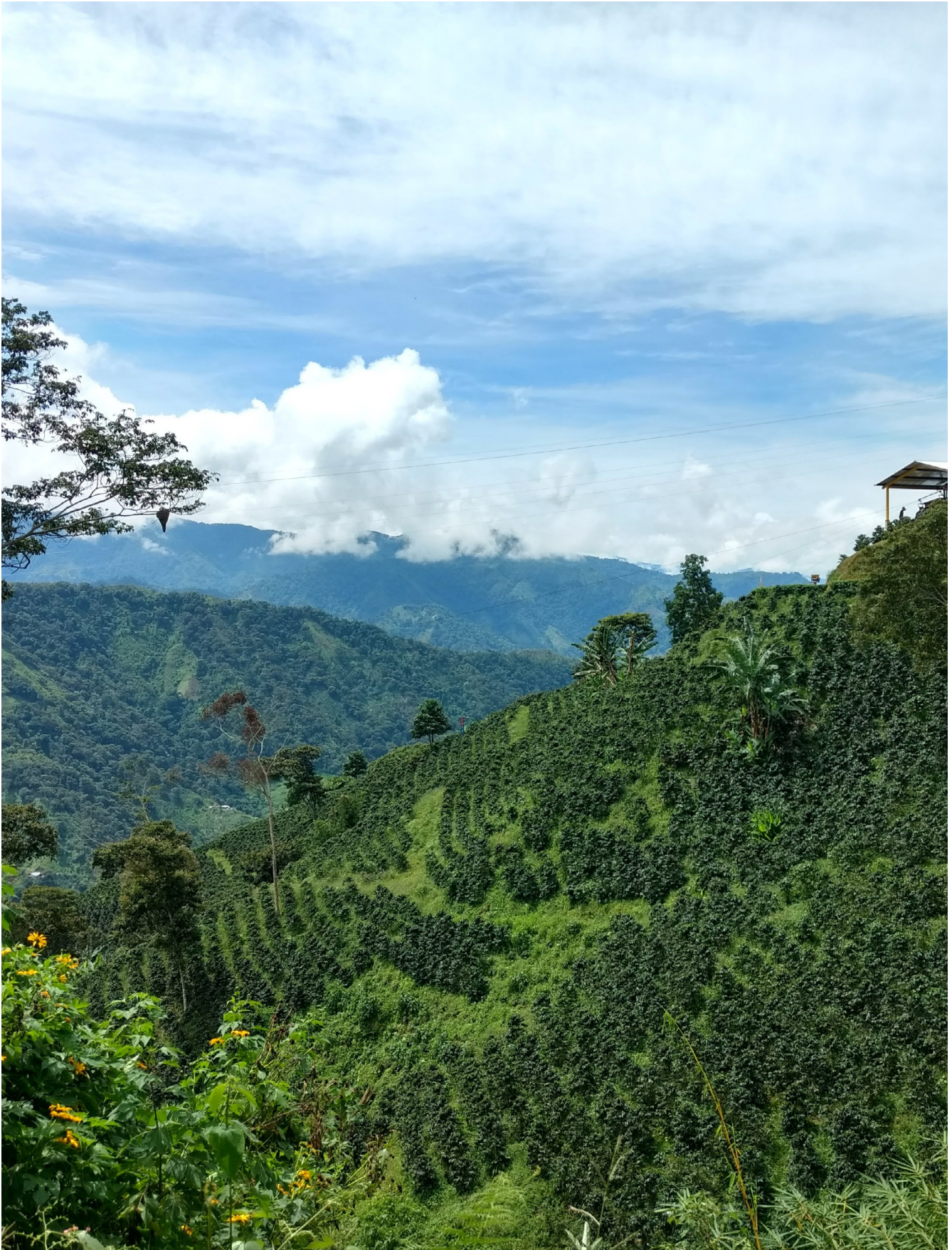
Imagen 2. Plantaciones.