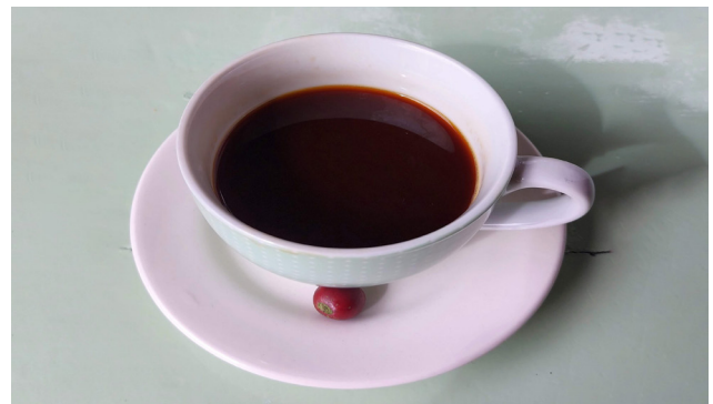
Imagen 11. Del fruto a la taza.