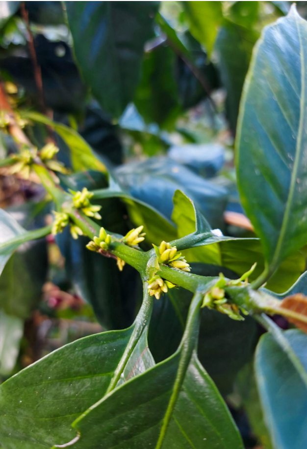
Imagen 6. De la flor al fruto.