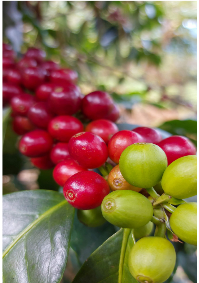
Imagen 7. De la flor al fruto.