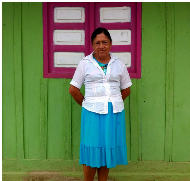
Imagen 1. Familias caficultoras.

Con esta serie fotográfica busco mostrar un poco de lo que significa el café desde mis ojos y, a través de ella, hablar sobre lo que hay detrás de una taza proveniente del corazón del mundo: la Sierra Nevada de Santa Marta.