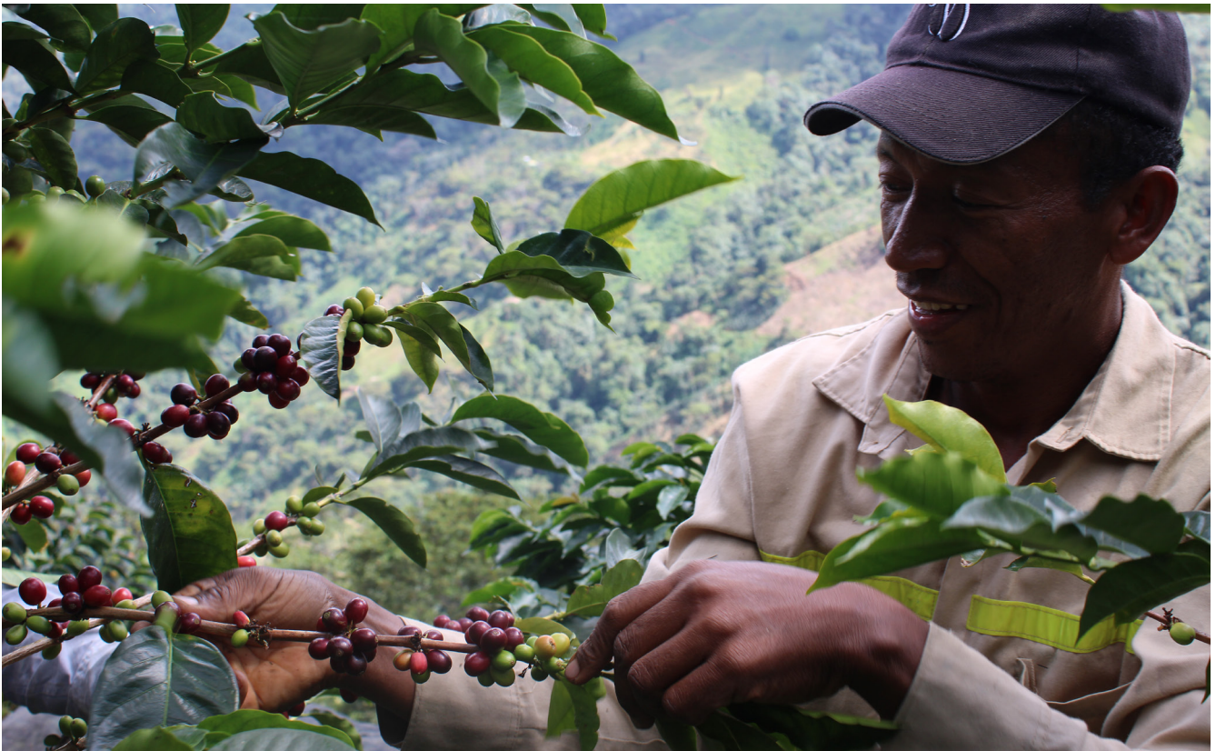
Imagen 4. Familias caficultoras.