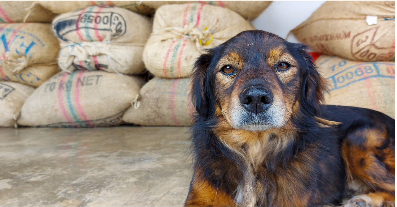
Imagen 5. Familias caficultoras.