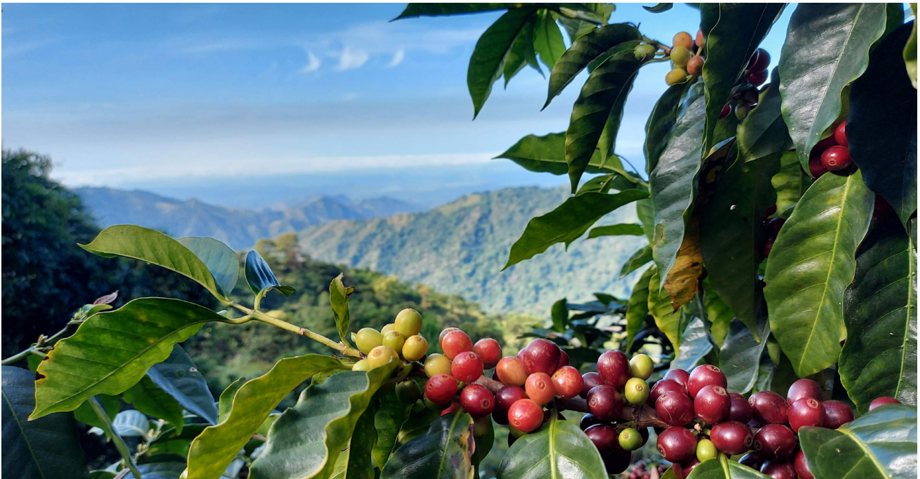
Imagen 8. De la flor al fruto.