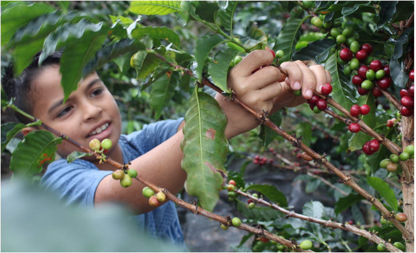
Imagen 3. Familias caficultoras.