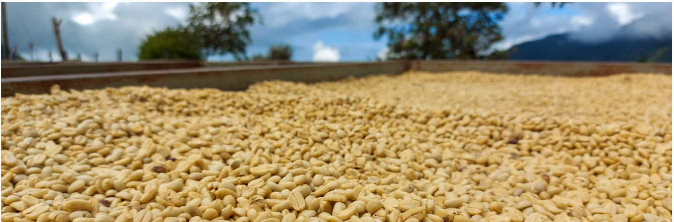
Imagen 9. De la flor al fruto.